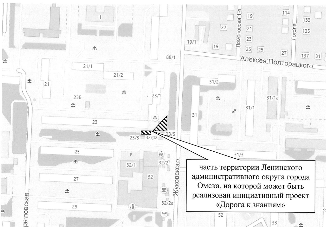
СХЕМА границ части территории Ленинского административного округа города Омска, на которой может быть реализован инициативный проект «Дорога к знаниям»