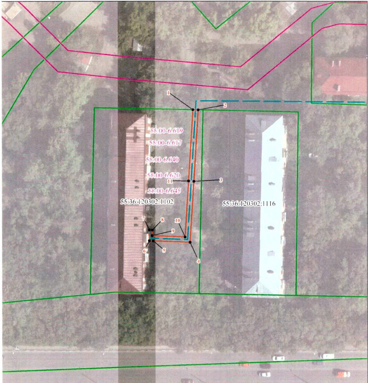
СХЕМА расположения границ публичного сервитута