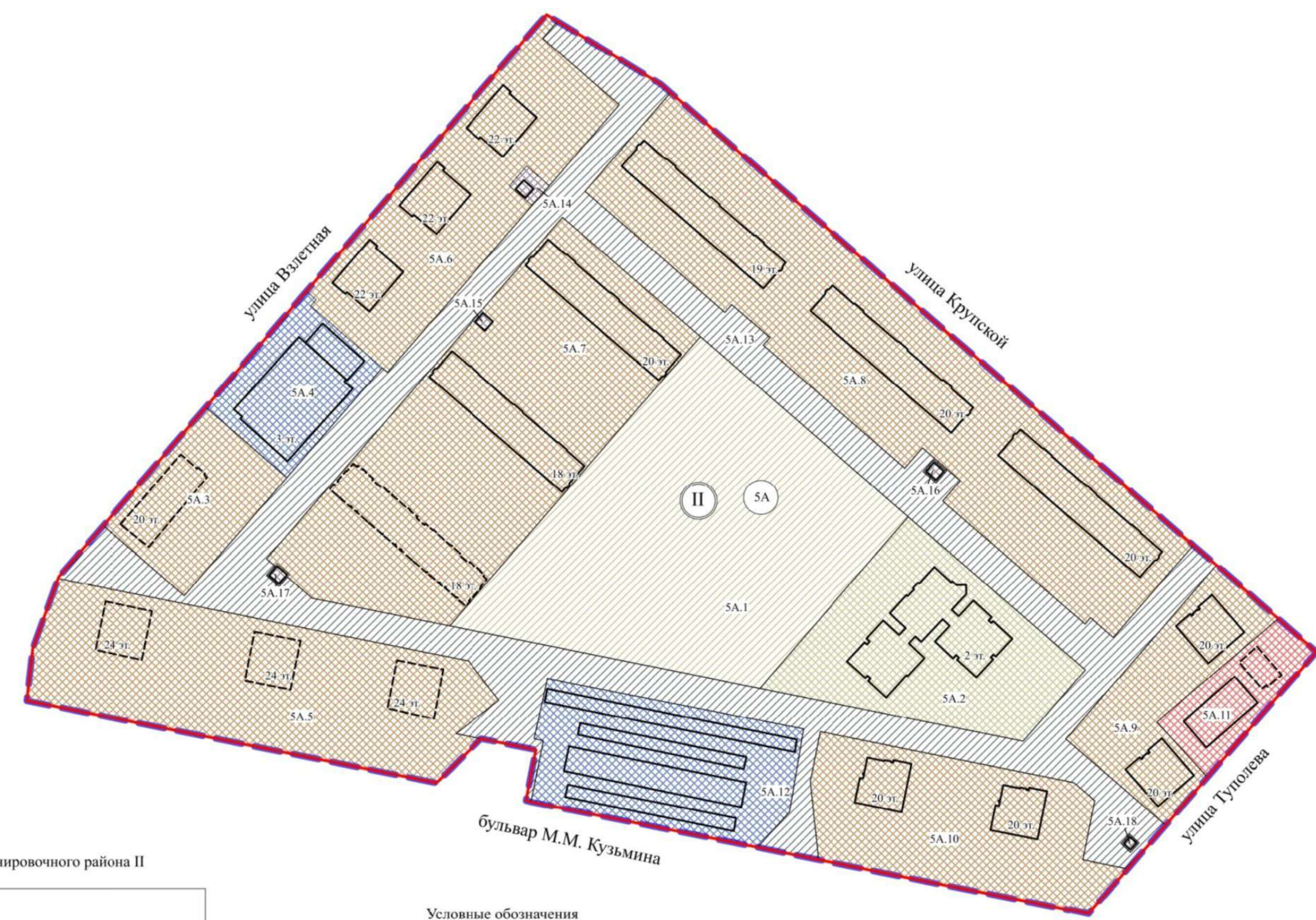
Экспликация зон элемента планировочной структуры 5А планировочного района II