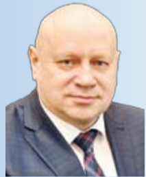
Мэр города Омска С.Н. Шелест

Считаем, очень важно поддерживать добрые и полезные начинания омичей, поскольку только единство горожан по ключевым вопросам развития города способно любые планы преобразовать в реальные свершения и вносить вклад Омска в процветание всей страны.