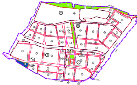
Схема размещения границ проектируемой и существующей планировочной структуры проекта планировки территории, расположенной в границах: улицы Луцкая - улица Волгоградская - улица 1-я Люблинская - левый берег реки Иргизы в Кировском административном округе города Омска

Примечание в проекте жилищной территории элементной планировочной структуры №1 планировочного района II проекта планировки территории, расположенной в границах: улицы Луцкая - улица Волгоградская - улица 1-я Люблинская - левый берег реки Иргизы в Кировском административном округе города Омска