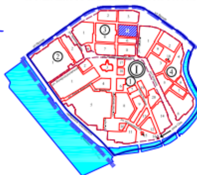
СХЕМА РАСПОЛОЖЕНИЯ ГРАНИЦ ПРОЕКТИРОВАНИЯ И ЭЛЕМЕНТОВ ПЛАНИРОВОЧНОЙ СТРУКТУРЫ