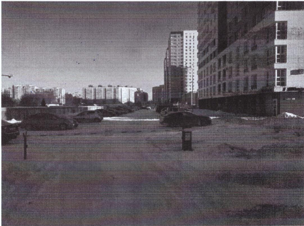
г. Омск, Кировский АО, в 22 м. юго-западнее многоквартирного дома № 9А по улице Взлетной