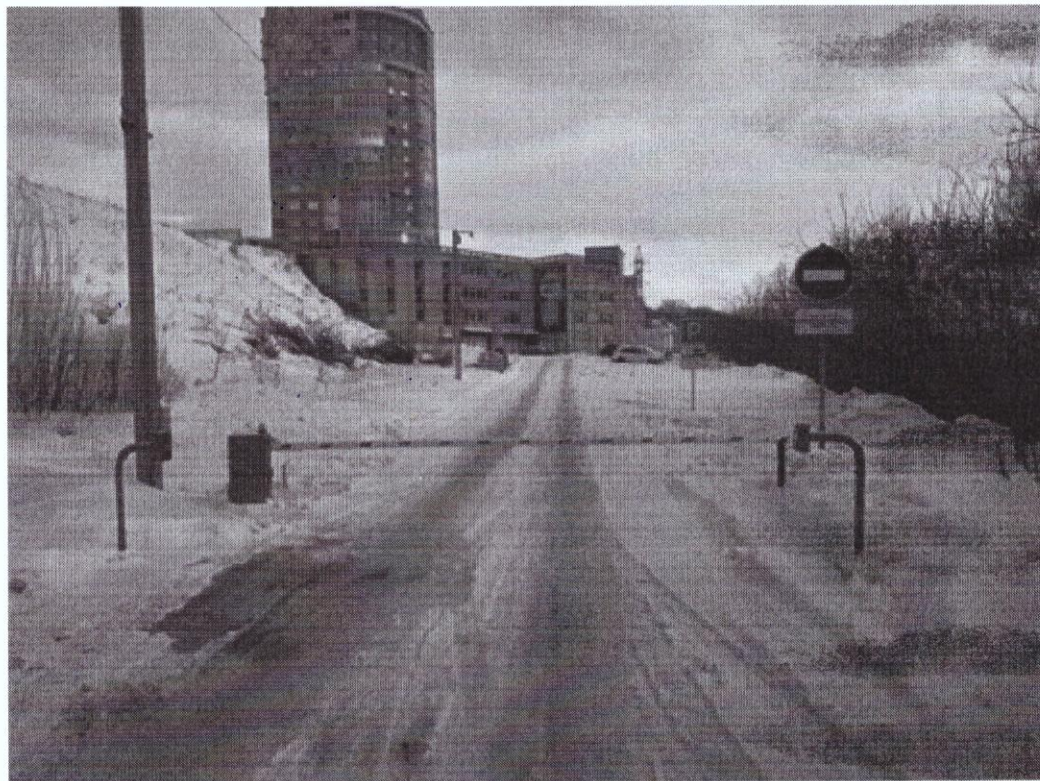
г. Омск, Центральный АО, в 85 м. южнее гаражного комплекса, расположенного по адресу: улица Госпитальная, дом 19Б