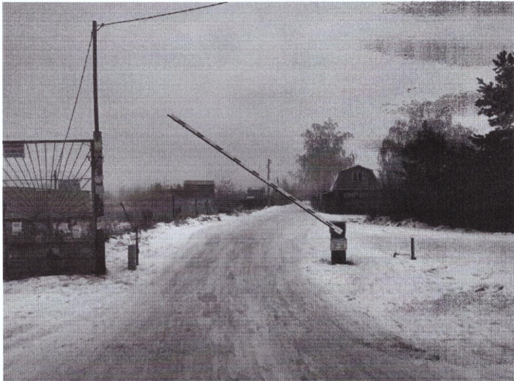
г. Омск, Октябрьский АО, в 60 м. юго-западнее участка № 182 в СНТ «Дружба»