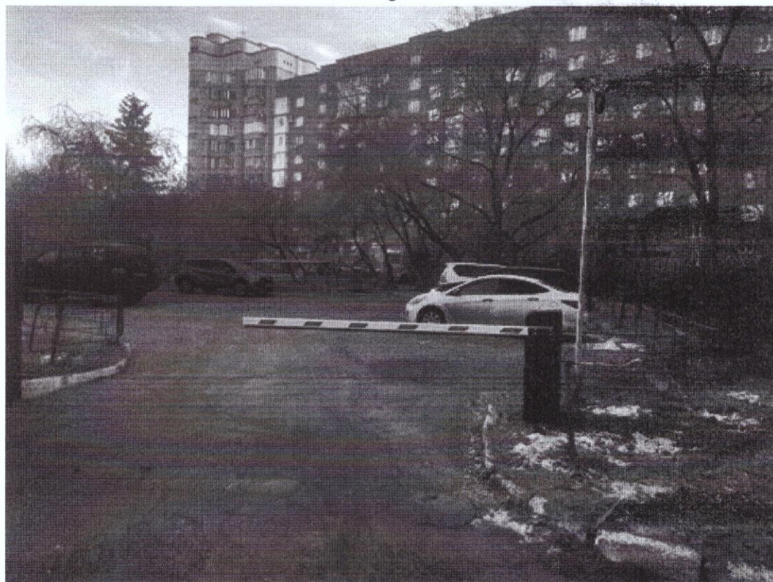
г. Омск, Центральный АО, в 20 м. северо-западнее многоквартирного дома № 13 по улице Орджоникидзе