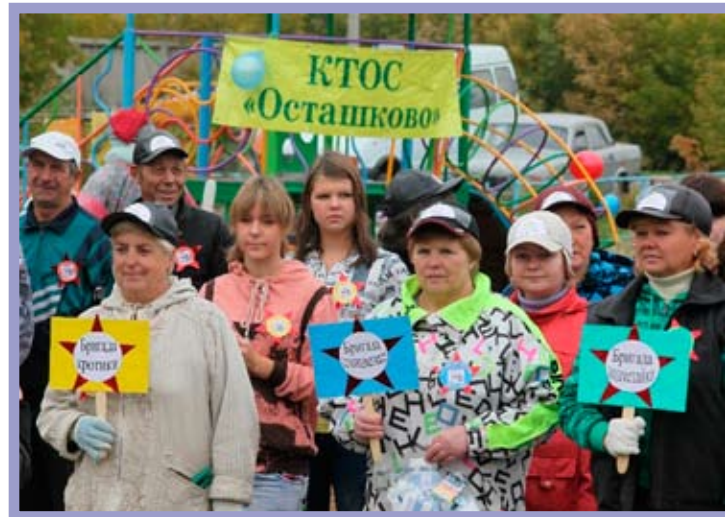
КТОС «Осташково» Октябрьского административного округа