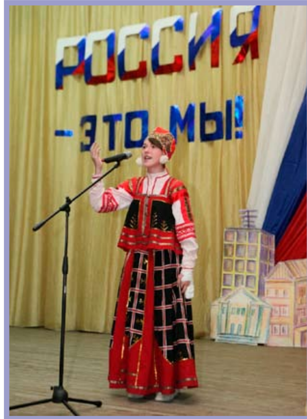
КТОС «Московка-1» Ленинского административного округа