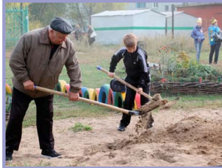
КТОС «Московка-1» Ленинского административного округа