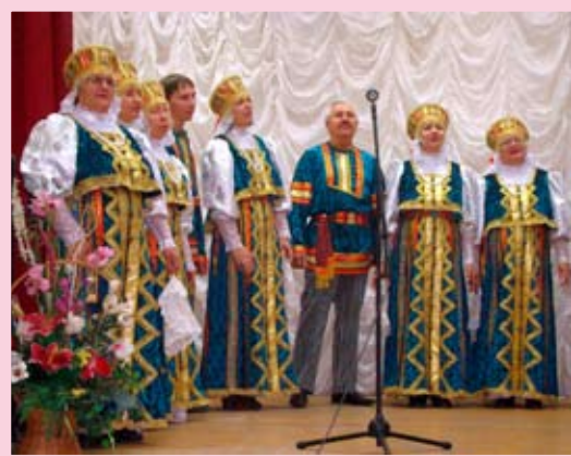
Народный хоровой коллектив НПО «Мир», лауреат фестиваля в номинации «Народная песня», КТОС «Амурский-2»