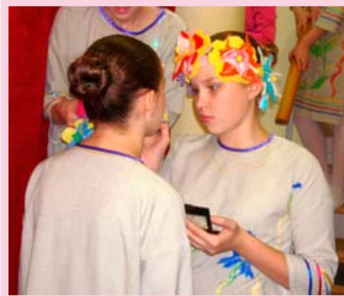
Детский фольклорный ансамбль «Тимоня», участник фестиваля в номинации «Народная песня», КТОС «Первокирпичный»