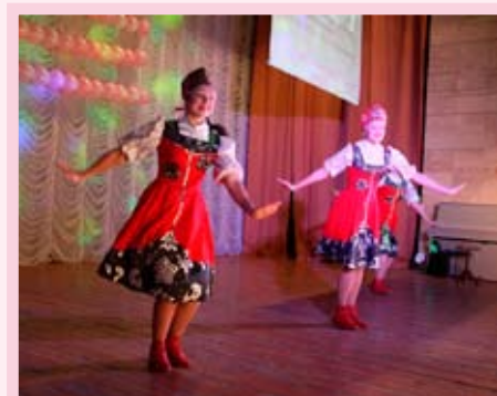
Танцевальная группа «Веснянка», участник фестиваля в номинации «Народный танец», КТОС «Левобережный-5»