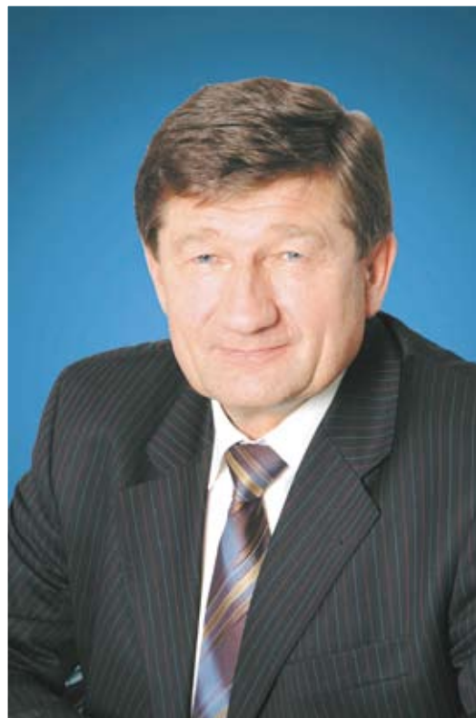
Мэр города Омска В.В. ДВОРАКОВСКИЙ

Пусть Омск всегда остаётся теплым и уютным домом, который хранит наши семьи, дарит спокойствие и радость. Добрых вам свершений, новых надежд и планов!