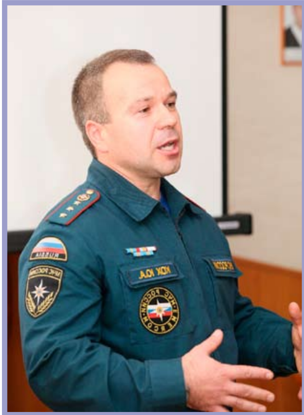
КТОС «Левобережный-1» Кировского административного округа