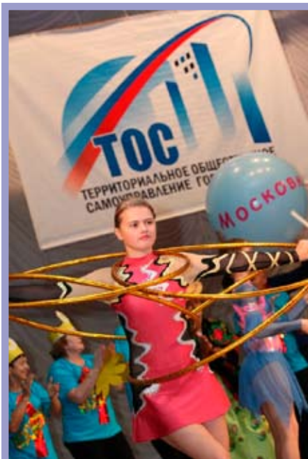
Презентация комитетов ТОС

Данный конкурс позволил выявить активных, энергичных омичей и еще раз доказал, что только побуждая активность населения, побуждая жителей к защите своих и общественных интересов, можно решить задачи, стоящие перед территориальным общественным самоуправлением.