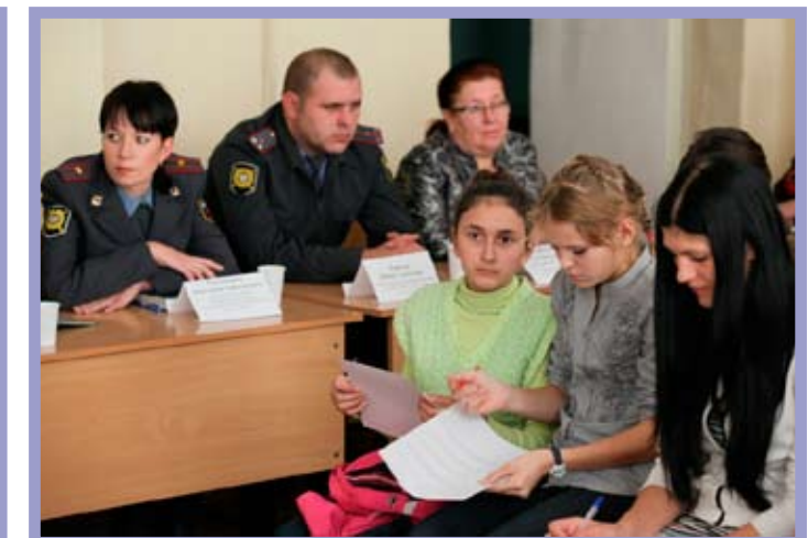
КТОС «Центральный-1» Центрального административного округа