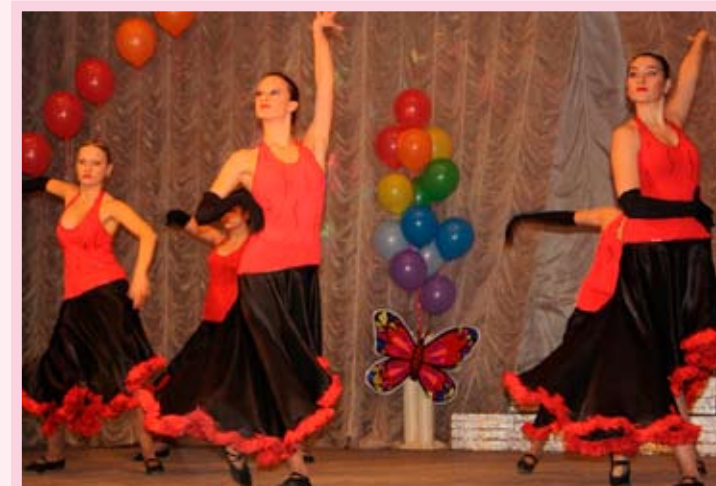
Ансамбль танца «Надежда», лауреат фестиваля в номинации «Эстрадный танец», КТОС «Светлый»