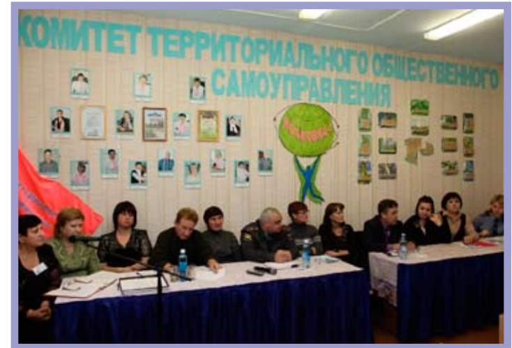
КТОС «Московка-1» Ленинского административного округа