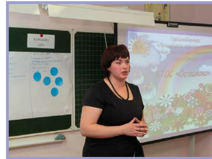
КТОС «Осташково» Октябрьского административного округа