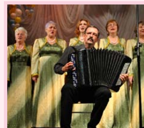
Народный хор «Душа Сибири», лауреат фестиваля в номинации «Народная песня», КТОС «Заозерный-2»