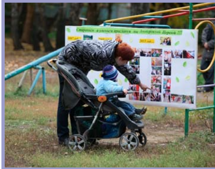
КТОС «Левобережный-1» Кировского административного округа