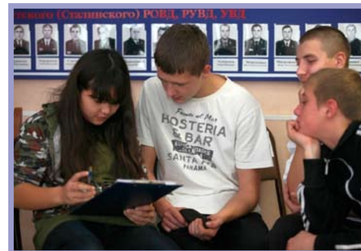
КТОС «Ермак» Советского административного округа