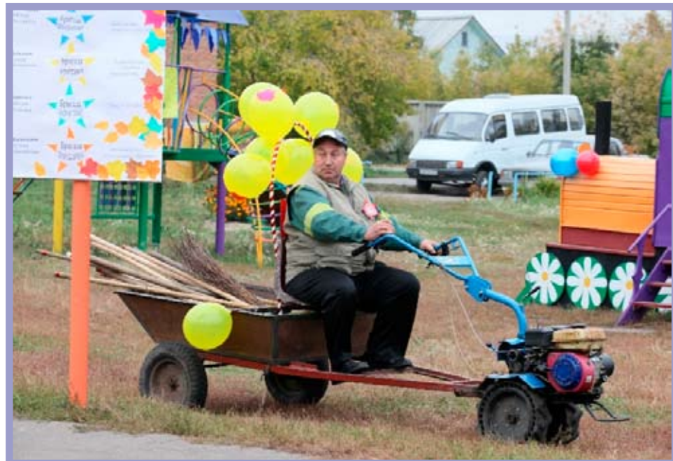
Благоустройство придомовых территорий