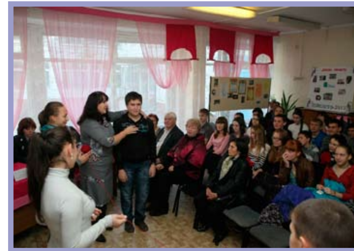
КТОС «Левобережный-1» Кировского административного округа