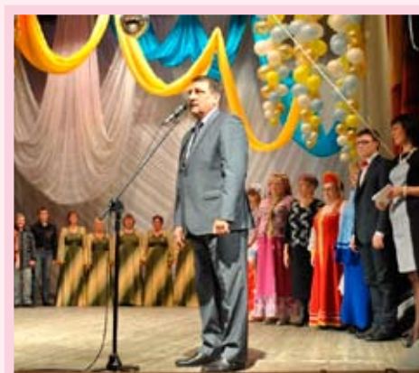
Подведение итогов фестиваля «Народные самоцветы»