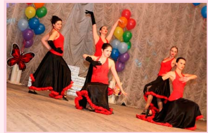
Ансамбль «Надежда», КТОС «Светлый»