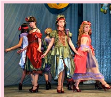
Танцевальная группа «Шалунья», Приз «За лучшее сценическое решение номера», КТОС «Водников»