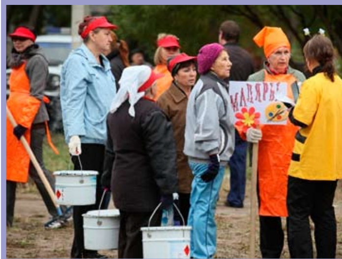
КТОС «Ермак» Советского административного округа