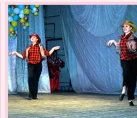
Образцовый танцевальный коллектив «Лира», лауреат фестиваля в номинации «Эстрадный танец», КТОС «Береговой»