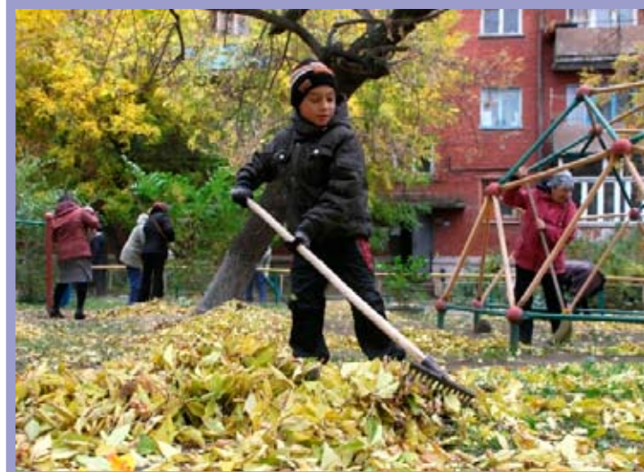
КТОС «Центральный-1» Центрального административного округа