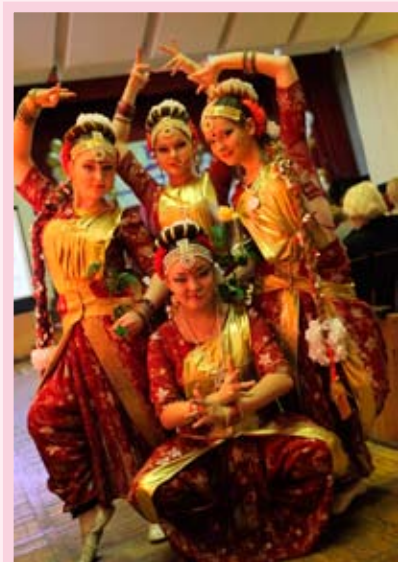
Ансамбль танца «Санам», лауреат фестиваля в номинации «Народный танец», КТОС «Рубин»