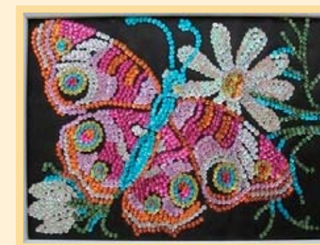
Яна Нестерчук, КТОС «Левобережный-11». Аппликация из пайеток «Лето»