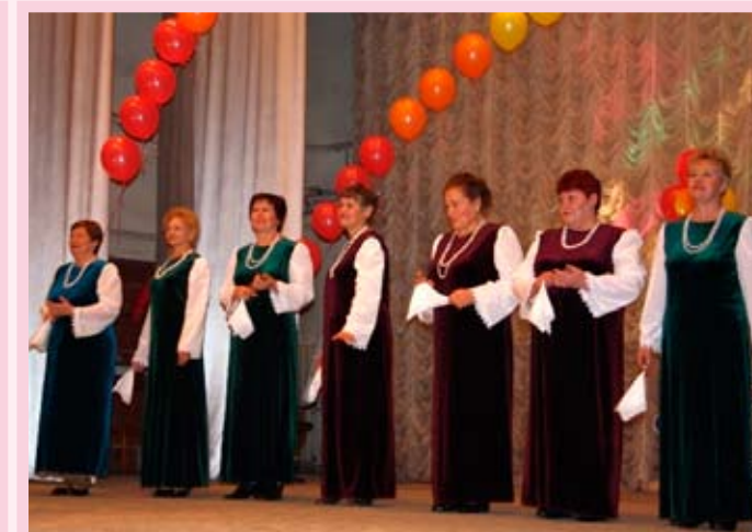
Ансамбль «Свирель», лауреат фестиваля в номинации «Народная песня», КТОС «Свердловский»