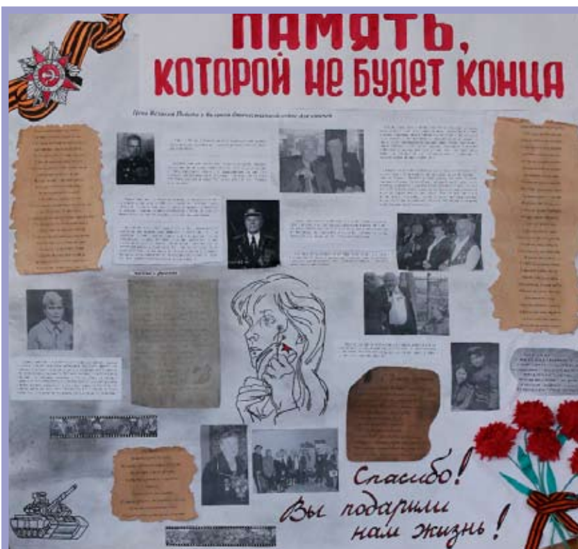
Патриотическое воспитание детей и подростков