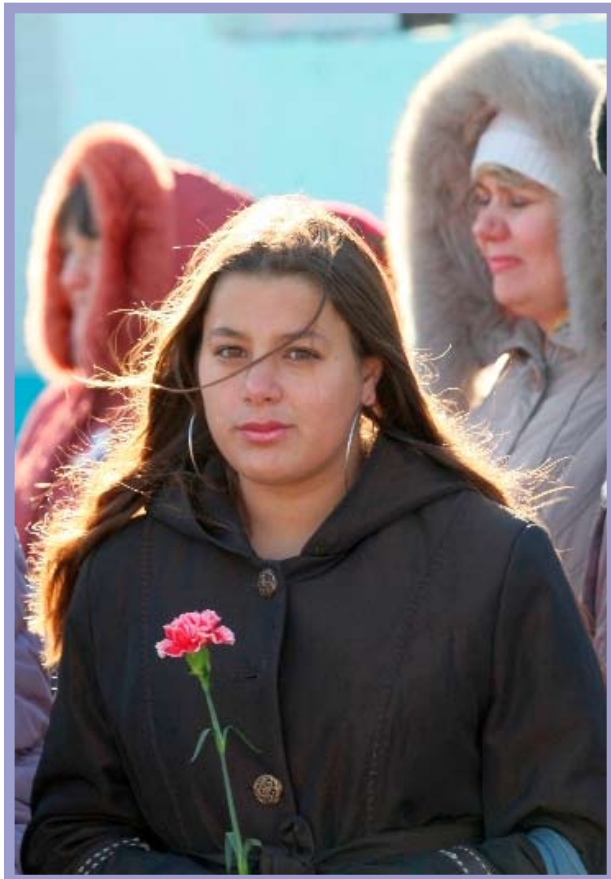
КТОС «Осташково» Октябрьского административного округа