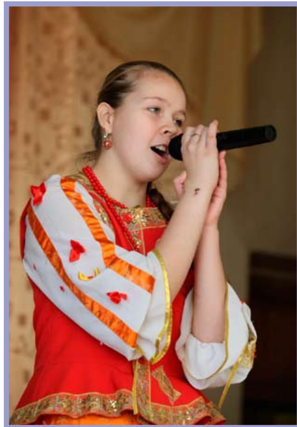
КТОС «Ермак» Советского административного округа