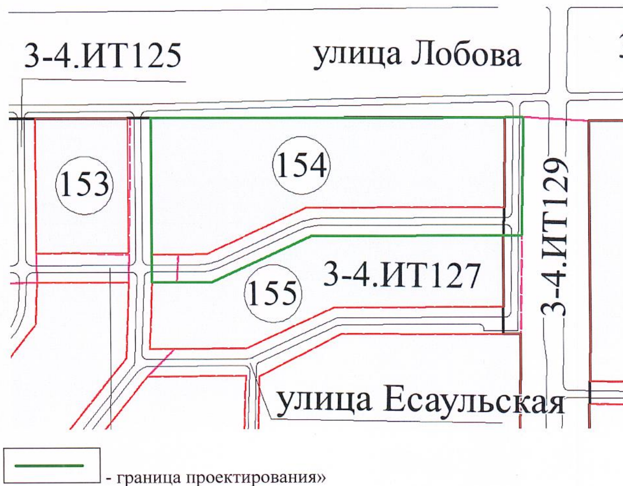
Схема границ проектируемой территории

«Приложение № 2 к распоряжению департамента архитектуры и градостроительства Администрации города Омска от 26.04.2004 № 488