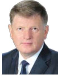
Председатель Омского городского Совета В. В. Корбут