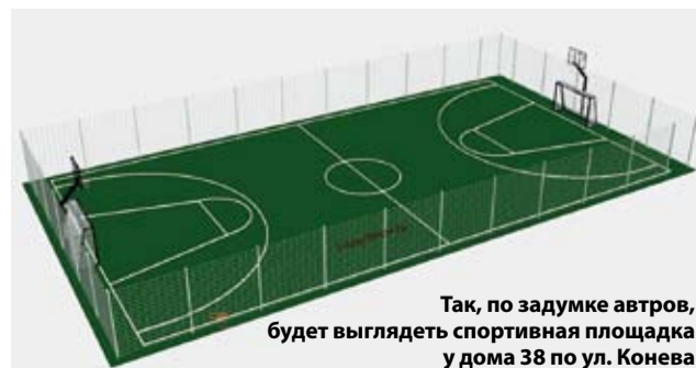
Так, по задумке авторов, будет выглядеть спортивная площадка у дома 38 по ул. Конева

Напомним, в прошлом году, благодаря инициативе неравнодушных горожан, на Левобережье благоустройство было выполнено на территории микрорайона Прибрежный и в сквере им. Ватутина.