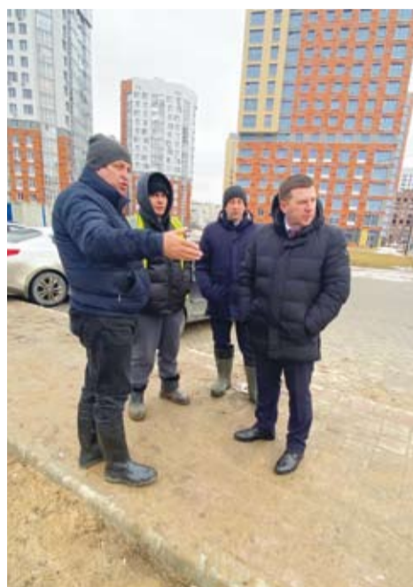
Мониторинг состояния территории округа выполняется в ежедневном режиме

От жителей микрорайона Кристалл поступило обращение о необходимости оборудовать подходы к остановке общественного транспорта. Силами окружного дорожно-