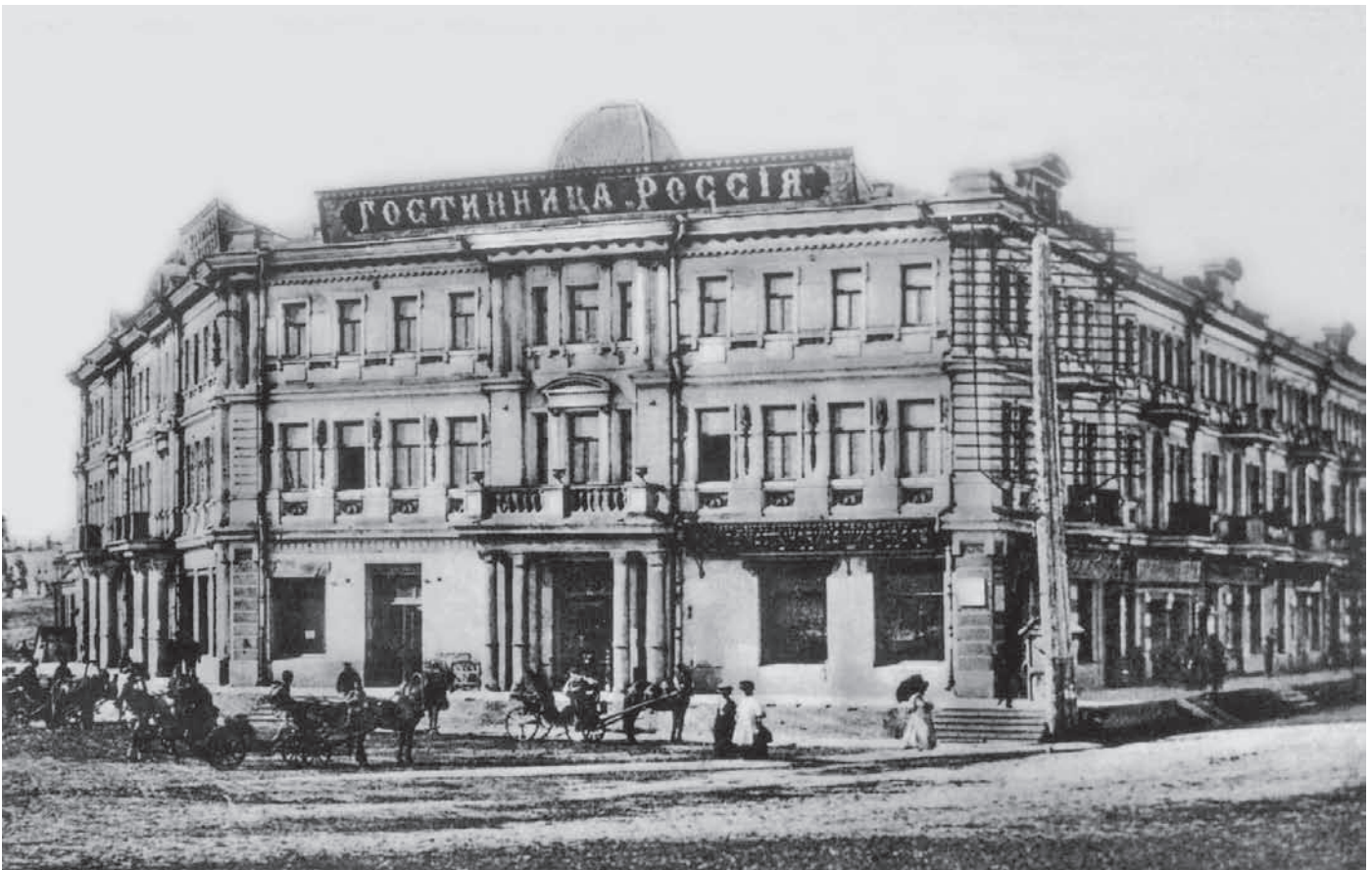
Гостиница «Россия» на Санниковском проспекте (ныне – ул. Партизанская, 2). 1906.