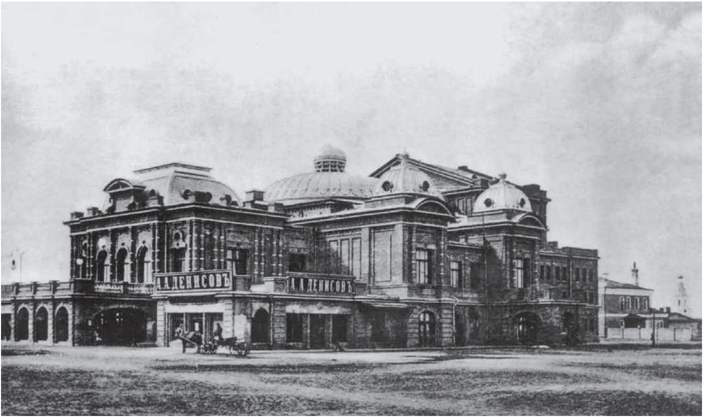
Академический театр драмы. 1904.