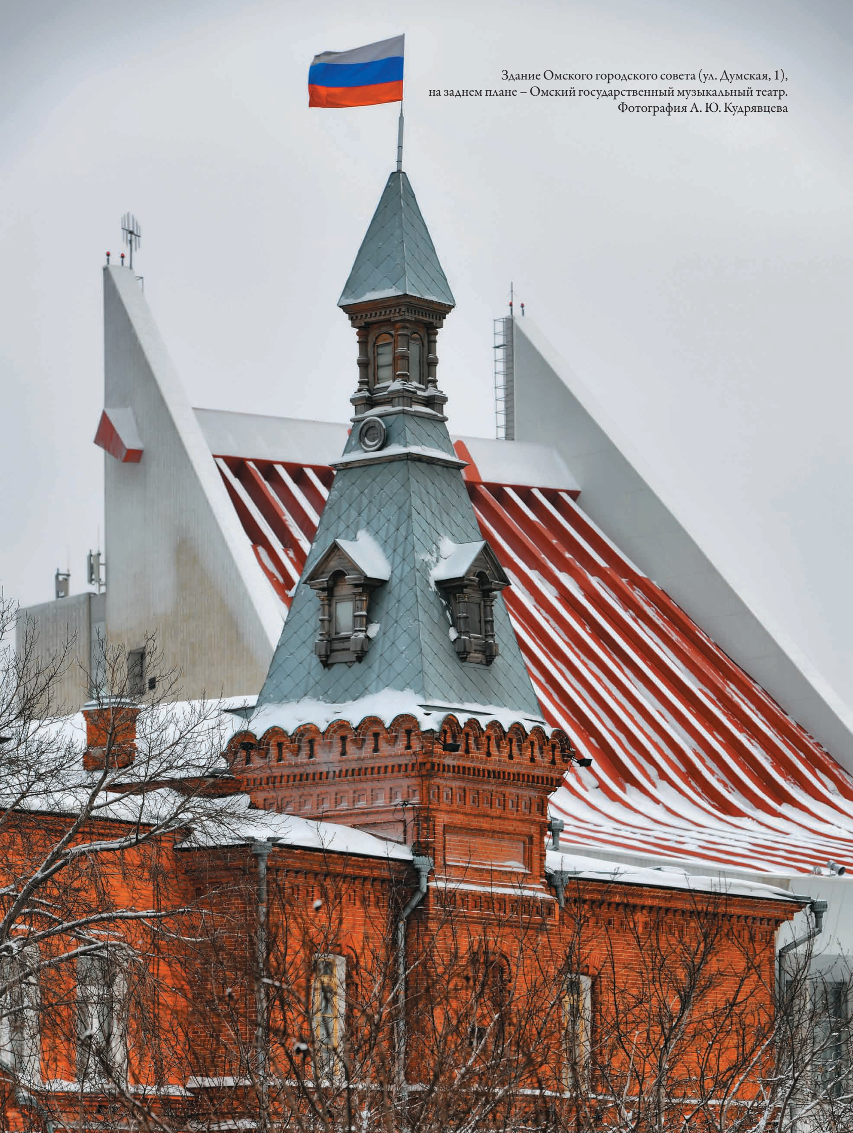
Здание Омского городского совета (ул. Думская, 1), на заднем плане – Омский государственный музыкальный театр.