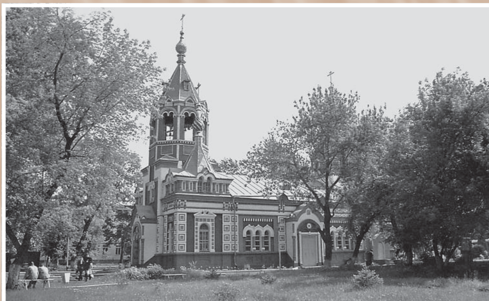
Госпитальная церковь во имя иконы Божьей Матери «Всех скорбящих Радости» после ремонта (ул. Гусарова, 4, кор. 3). Из фондов МИСО