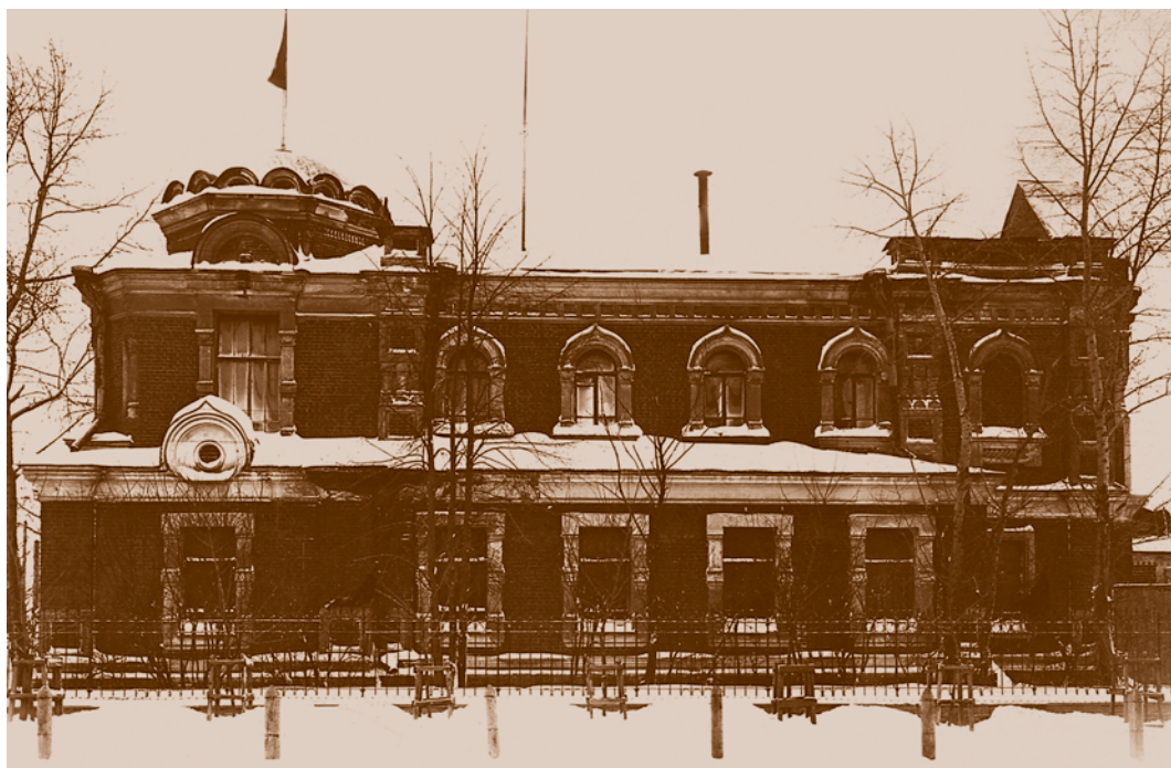
Дом правопорядка (бывший архиерейский дом). Фотография 1920-х гг.

К 1922 г. в Сибири были закрыты домовые и ведомственные храмы, национализированы культовые здания. Так, в Омске в начале 1920 г. отделу социального обеспечения был передан Михайло-Архангельский женский монастырь на Тюремной улице (современная ул. 5-й Армии) для размещения детского дома-распределителя. Но Георгиевский храм (церковь во имя Георгия Победоносца) оставался действующим. С ним связаны последние годы жизни священника П. П. Введенского. В марте 1921 г. была закрыта Скорбященская церковь. Здание использовалось как госпитальный склад, колокольня, купол и шатры были снесены. Вследствие того что Серафимо-Алексиевская часовня была приписана к Скорбященской церкви военного