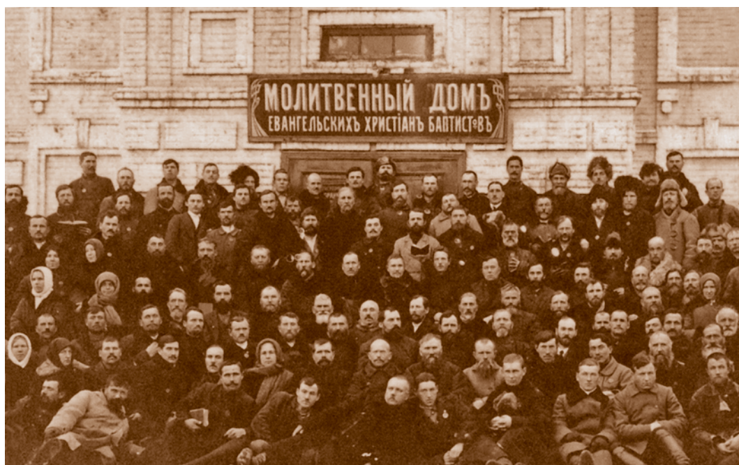
Участники съезда Сибирского союза евангельских христиан-баптистов у молитвенного дома омской общины. 1926.