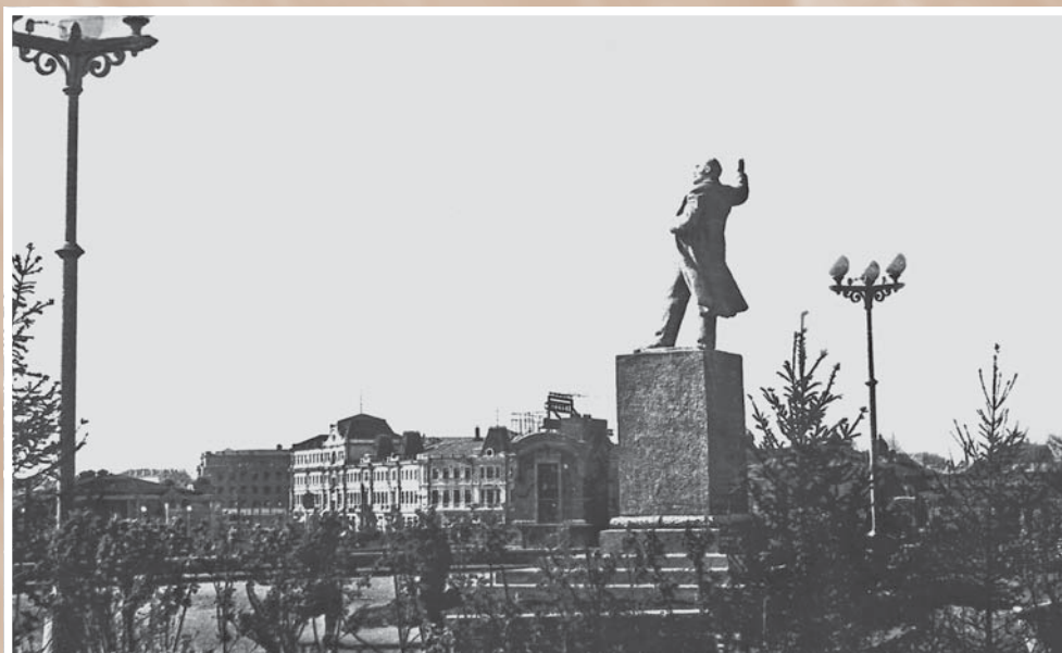
Памятник В. И. Ленину на месте Ильинской церкви. Фотография 1950-х гг.