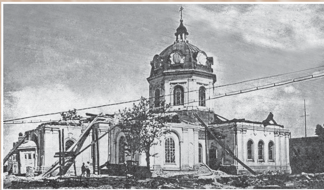
Ильинская церковь во время сноса. Построена в 1789 г. в Ильинском форштадте. В 1920-х – начале 1930-х гг. – кафедральный собор епархии. Снесена в 1936 г.