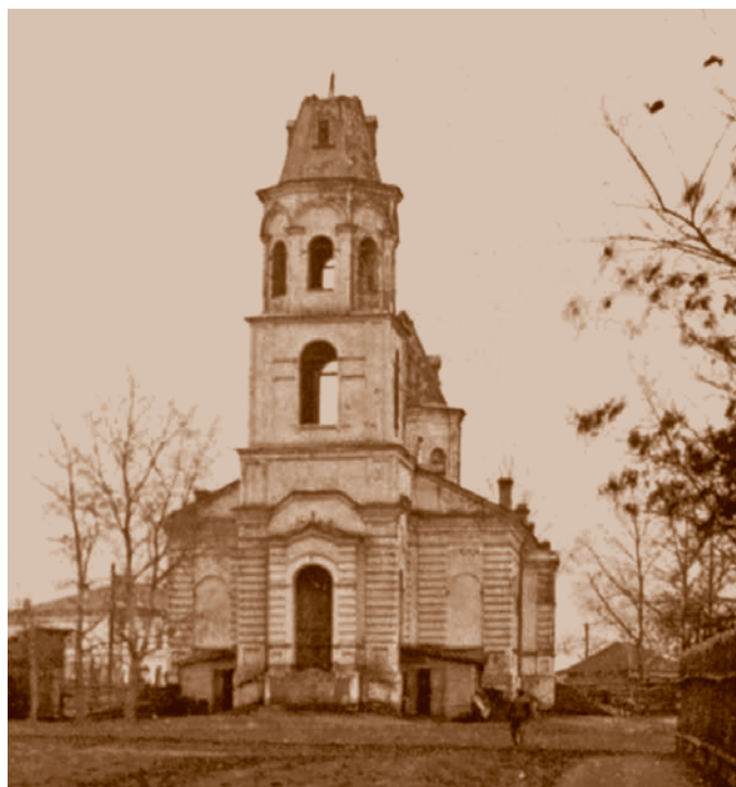
Богородице-Братская церковь во имя Божьей Матери «Утоли Моя Печали».