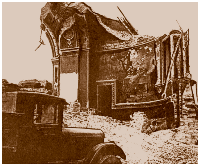
Успенский кафедральный собор после взрыва. Фрагмент алтарной стены. 1935. Собор построен в 1898 г., в 1935 г. взорван. Восстановлен в 2007 г.

В феврале 1939 г. Куйбышевский райсовет Омска принял постановление о закрытии Параскевиевской церкви, хотя в «Списке религиозных культов по Омску и району» за 1936 г. в этой церкви числилось 320 прихожан,