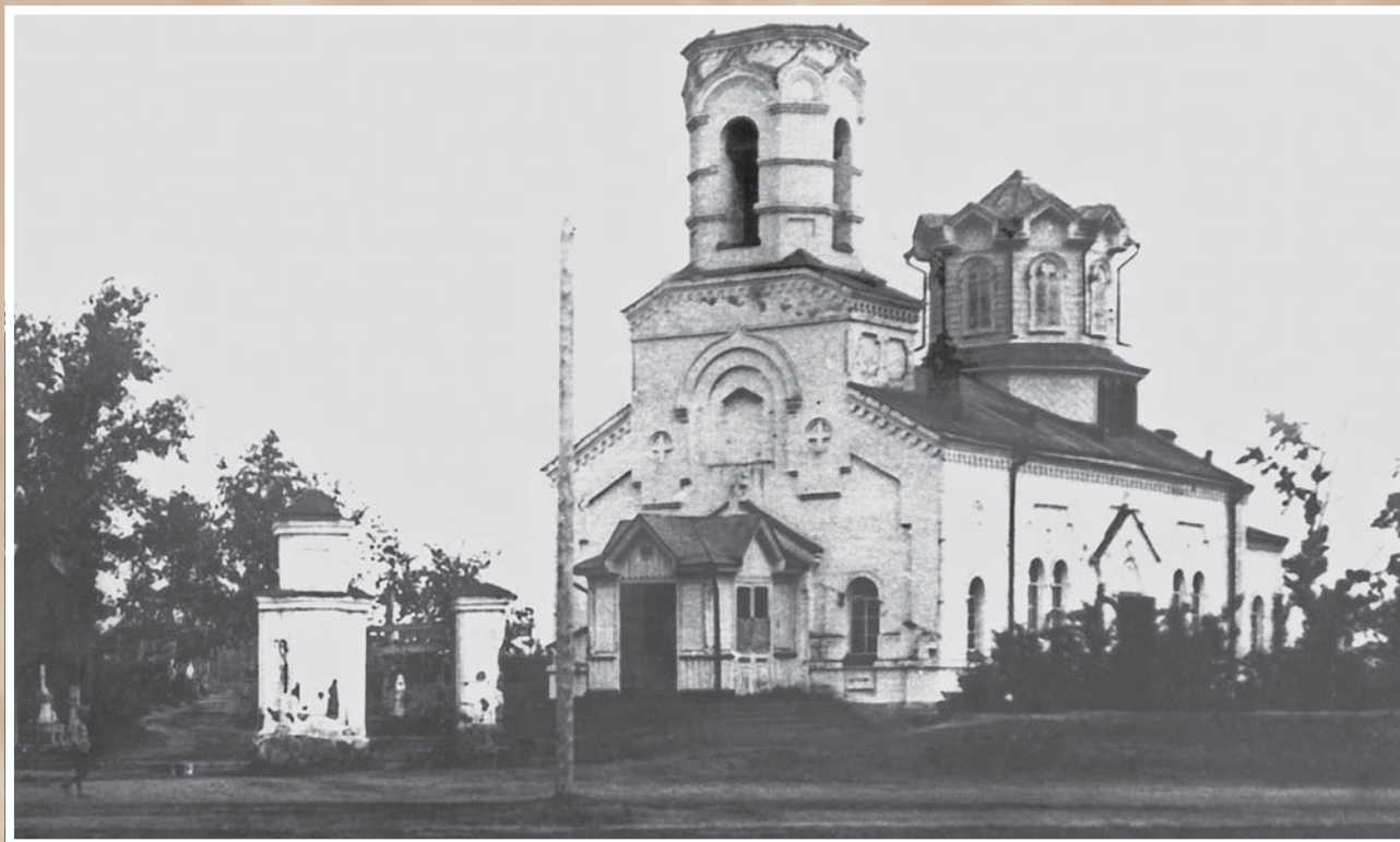
Церковь во имя Святого Павла Комельского Чудотворца на Шепелевском кладбище. Фотография конца 1930-х гг. из фондов ОГИК музея. Построена в 1902 г. на западной окраине города. Закрыта в начале 1930-х гг. и вскоре снесена