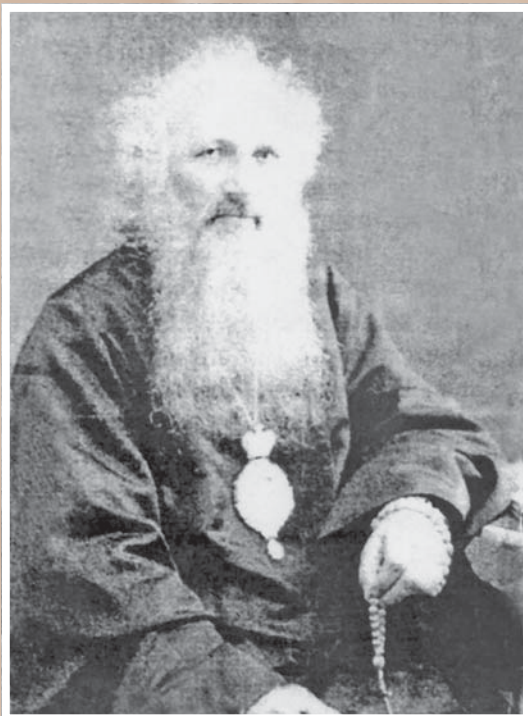
Архиепископ Сильвестр (И. Л. Ольшевский; 1860–1920). На Омской кафедре с августа 1915-го по 1920 г. Скончался в заключении