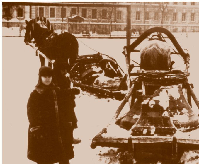
Вывоз колоколов Никольского казачьего собора. Никольская казачья церковь построена в 1840 г. С 1916-го – собор. В 1928 г. здание передали «под культурные нужды». В 1991 г. оно было возвращено епархии

Но церкви лишались не только колоколов – из храмов изымались и библиотеки. В 1930 г. изымали библиотеку, состоявшую из 464 книг, подшивок журналов и газет «Русская земля», «Степной край», из Параскевиевской церкви; 16 декабря этого же года была сдана государству библиотека исполнительным органом Георгиевской общины.