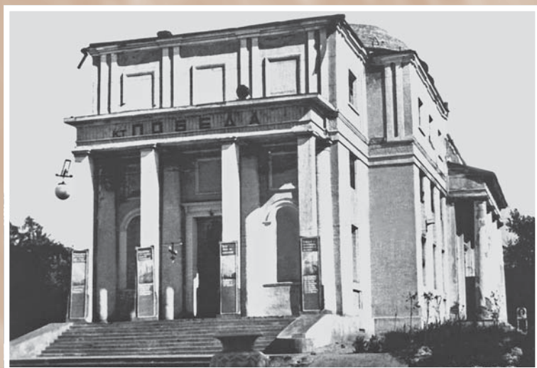
Кинотеатр «Победа» (бывшая Никольская казачья церковь). Фотография 1940-х гг.