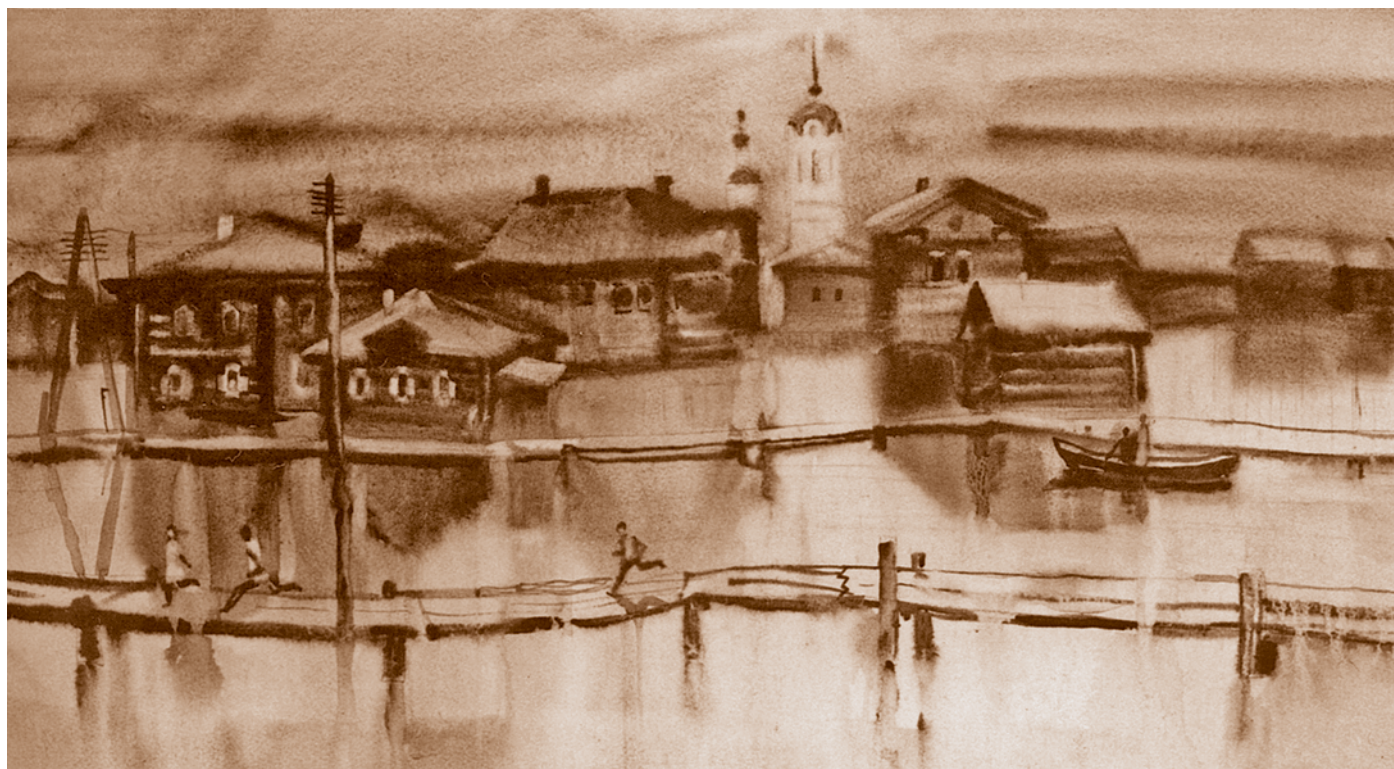
С. К. Белов. Большая вода. 1988. Бумага, акварель. 50 x 80. Из собрания ООМПИИ им. М. А. Врубеля

Таким образом, конец 1980-х – начало 1990-х гг. были отмечены «высокой степенью творческой индивидуализации». Художественная молодежь стремилась раскрыть и утвердить свое непосредственное видение и понимание современности. Шли активные поиски способов самовыражения, собственного оригинального художественного языка. В искусстве происходили жанровые и видовые смешения, пересекались различные тенденции – неоэкспрессионизма, неопрimitивизма, сюрреализма, концептуализма, абстрактного искусства. В новой поэтике заметно возросло значение символично-метафорических структур. На это время приходится всплеск экспериментов с живописными и графическими техниками, означающими «отказ от профессиональных приемов и приемчиков».