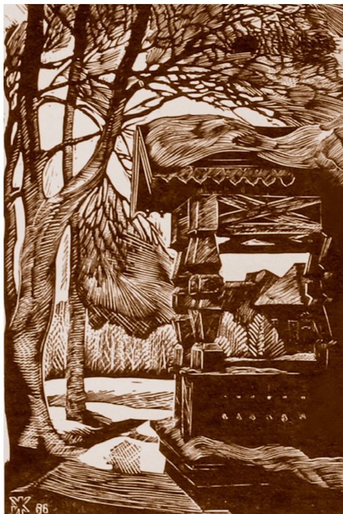
И. И. Желиостов. Деревянное крылечко. 1986. Бумага, гравюра на пластике. 15,0 x 9,5

Камерная графика талантливого художника-«семидесятника» А. А. Темерева, созданная в это время, привлекала поэтическим преображением обыденной действительности, несла в себе обаяние «наивного мироощущения» и стремление к философским обобщениям («Циклон идет», «Час прилива», «Пейзаж с рыбаком», 1986; серия «Собачья радости», 1991).