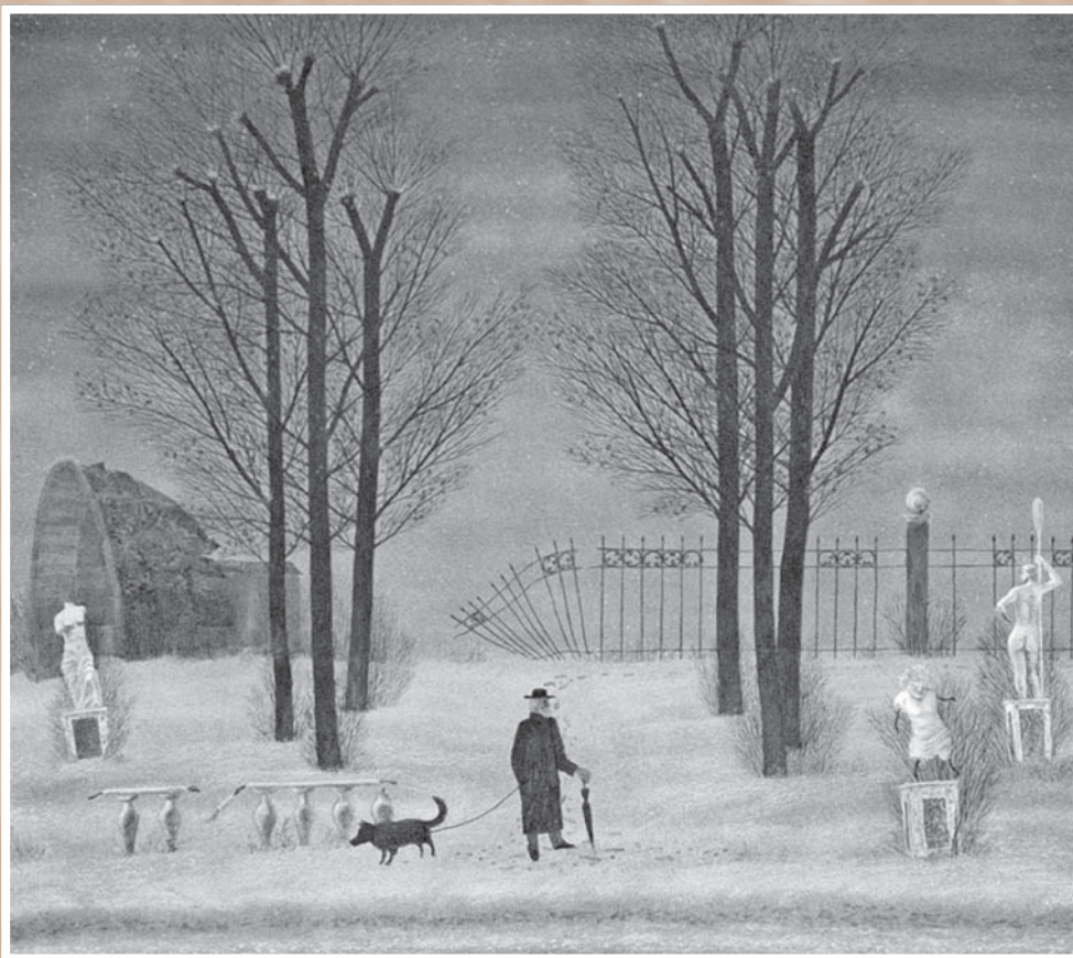
А. А. Темерев. В парке. Из серии «Собачьи радости». 1991. Бумага, акварель. 51 х 58. Из собрания ГМИО