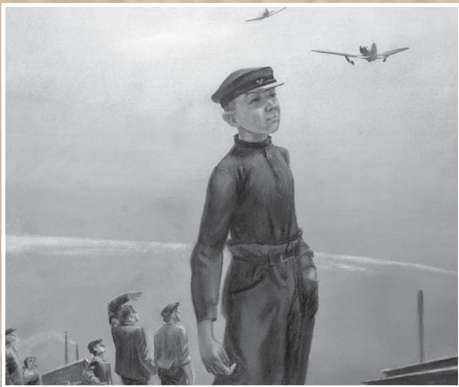
В. Л. Долгушин. Новая эскадрилья. Из серии «Все для фронта!». 1985. Бумага, пастель. 60 х 70. Из собрания ООМПИИ им. М. А. Врубеля