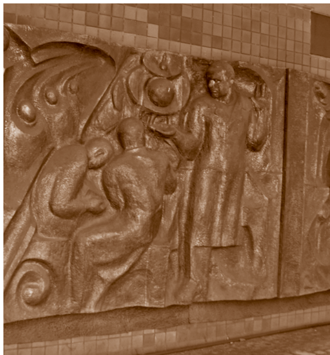
А. А. Цымбал. Горельефы на новом здании Омского государственного технического университета (проспект Мира, 11). Фотография А. А. Новиковой 2009 г.

На 1980–1990-е гг. приходится подъем монументальной и городской скульптуры. В конце 1980-х к произведениям монументального искусства в Омске добавились горельефы на фасаде нового корпуса государственного