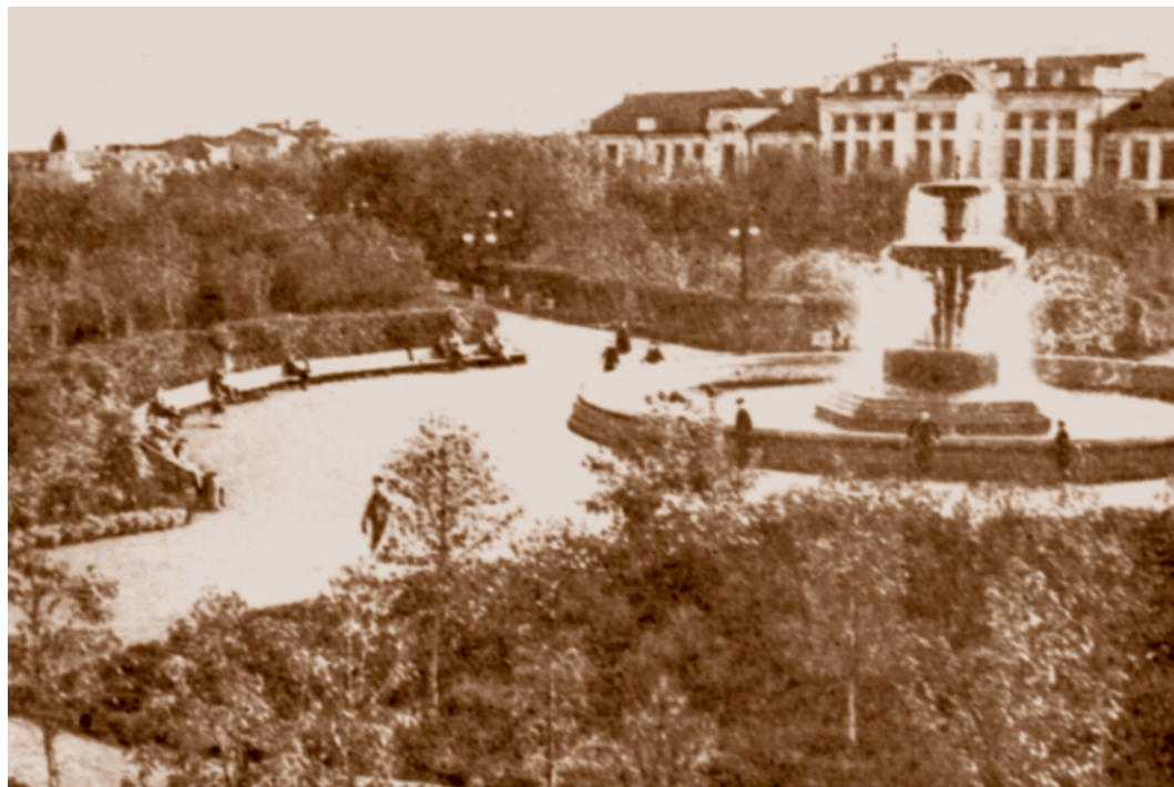
Сквер на площади Дзержинского. Из фондов МИСО.

Создан в 1944 г. по проекту архитектора П. М. Розенблюма на месте огромного пустыря с ямами и непроходимой грязью. В XIX в. здесь располагался Центральный базар. В 1958 г. в сквере устроили декоративный бассейн с облицованным полированным гранитом фонтаном, напоминающим многоярусную вазу