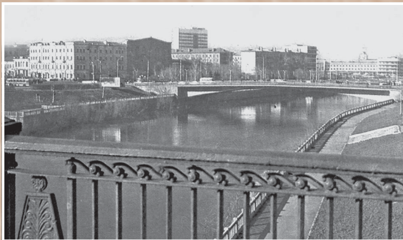
Мосты через Омь. Фотография 1969 г. из книги «Городские мотивы» (Омск, 1991).

В годы «оттепели» транспортная ситуация в городе значительно улучшилась благодаря строительству трех мостов через Омь и Ленинградского моста через Иртыш