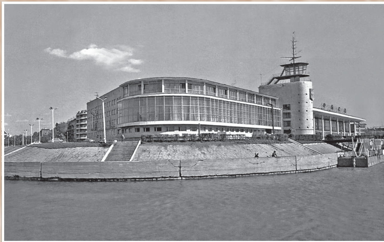
Речной вокзал с гостиничным комплексом «Маяк». 1960-е. Архитектор Т. П. Садовский.

В годы «оттепели» транспортная ситуация в городе значительно улучшилась благодаря строительству трех мостов через Омь и Ленинградского моста через Иртыш