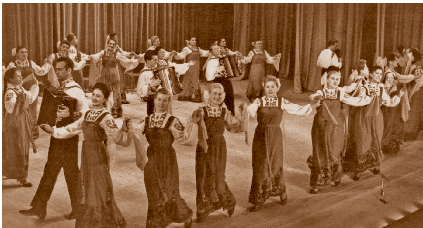
Женский хоровод «Ой да, во зеленой луговине» в исполнении артистов Государственного Омского русского народного хора на сцене Концертного зала. 1960-е.

О размахе культурного строительства в первой половине 1960-х гг. свидетельствует, в частности, список объектов культуры, введенных в эксплуатацию в Омске: Дворец культуры нефтяников в Советском районе, Дворец культуры «Юность» в Октябрьском, Дом культуры в Кировском,