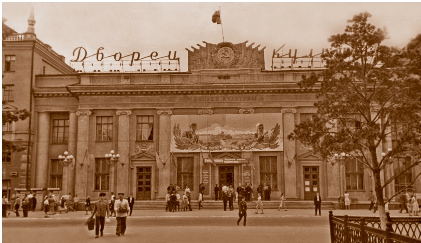
Дворец культуры моторостроительного завода им. П. И. Баранова на ул. Б. Хмельницкого. Построен в 1956 г. Проект Государственного НИИ авиационной промышленности – Гипроавиапрома. Архитектор П. И. Круткин

В годы «оттепели» наблюдается расширение сети медицинских учреждений. В 1958 г. сданы стоматологическая поликлиника, две больницы, в 1960-м – семь больничных корпусов, в 1962 г. – два больничных корпуса и две поликлиники. Этот процесс сопровождался ростом количества медицинских кадров. Если в 1959 г. в Омске было 2,7 тыс. врачей (без военнослужащих) и 8,3 тыс. среднего медицинского персонала, то к началу 1965 г. эти цифры выросли уже до 3,8 тыс. врачей и 11 тыс. медработников среднего звена. Особое внимание уделялось строительству лечебных учреждений для подрастающего поколения. В частности, в 1956 г. в Кировском районе была организована объединенная детская городская больница № 16