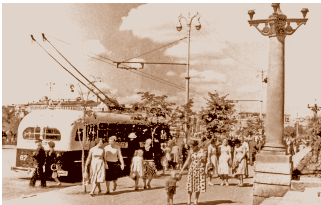
Троллейбусная остановка у сквера им. 30-летия ВЛКСМ. Появление в 1955 г. на омских улицах первого в Сибири троллейбуса стало событием в жизни города

К 1965 г. площади зеленых насаждений в пределах городской черты составляли 6 169 гектаров. На каждого омича приходилось до 87 кв. м зеленых насаждений, в том числе насаждений общего пользования 42,3 кв. м. О темпах и масштабах зеленого строительства в городе говорит тот факт, что только в 1964 г. были созданы 134 гектара зеленых насаждений, разбиты новые газоны на площади 96 гектаров, высажено 19 млн цветов, 352 тыс. деревьев и 186 тыс. кустарников. Значительная часть работ по озеленению проводилась омичами на субботниках и воскресниках. С 1951 г. стало традицией ежегодное проведение в городе выставки цветоводства и садоводства.