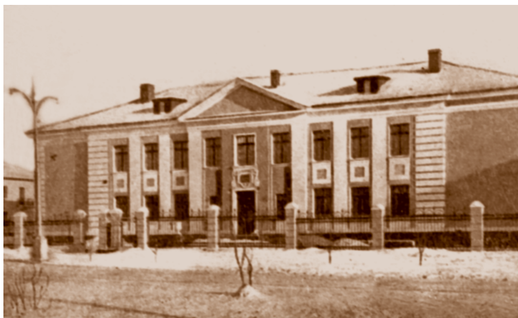
Одна из новостроек периода «оттепели» – школьное здание в городке Нефтяников. Начало 1960-х.

В годы «оттепели» принимались специальные программы повышения уровня работы общеобразовательных школ. Одной из главных задач в этой связи стало развитие сети школ и укрепление их материальной базы. В Омске в конце 1950-х гг. каждая вторая школа работала в три смены. Не хватало учебных кабинетов, мастерских, лаборато-