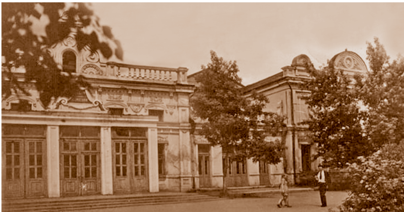
Здание Омского театра музыкальной комедии – памятник истории и архитектуры. 1950-е.

Органы КПСС поддерживали развитие самодеятельных театров, хотя в то же время стремились обеспечить их «правильную» идеологическую направленность. В конце