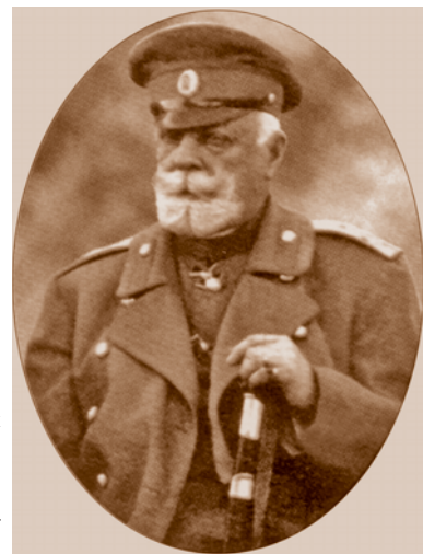
Н. А. Сухомлинов – генерал-губернатор Степного генерал-губернаторства, командующий войсками Омского военного округа, войсковой наказной атаман Сибирского казачьего войска (1915–1917 гг.)*

После состоявшихся выборов от воинских частей в Совете произошло разделение на рабочий и военный отделы. Вскоре общее собрание Совета утвердило и новый, расширенный список членов своего исполкома. С течением времени структура и состав исполнительных органов Совета менялись: возникали новые должности, например