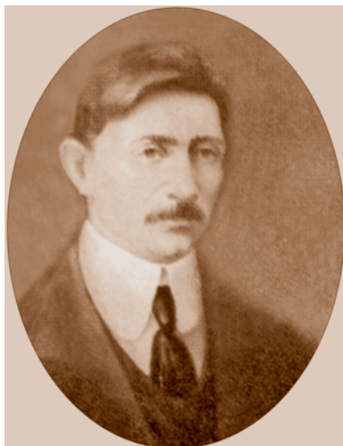
А. Е. Новоселов (1884–1918) – сибирский писатель и этнограф, эсер*.

В августе 1917 г. был избран комиссаром Временного правительства по Акмолинской области. С конца сентября исполнял обязанности комиссара по всему Степному генерал-губернаторству