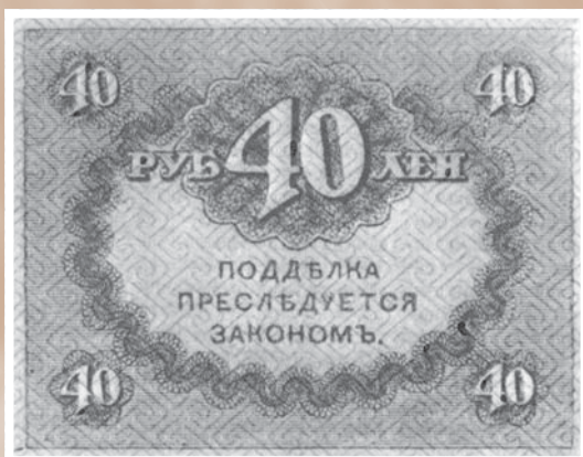
Бумажные денежные знаки – «керенки»*. Выпускались при Временном правительстве А. Ф. Керенского и имели хождение в 1917–1920 гг.

думы. В итоге после длительных дебатов и консультаций городской головой был избран эсер-центрист В. В. Паскевич, председателем думы – правый эсер Г. М. Котляров.