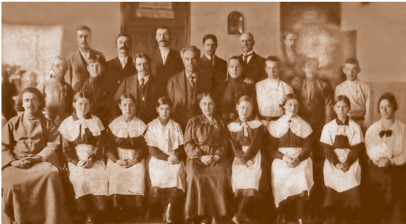
Выпускной, четвертый класс и преподаватели второго высшего начального училища Министерства народного просвещения. 1917.