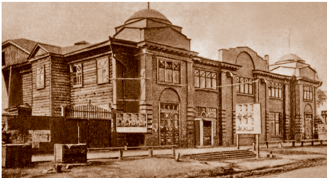
Кинотеатр «Гигант» в Санниковском переулке (сейчас – ул. Партизанская). Открытка 1928 г.

Вскоре после победы революции, несмотря на относительно мирное течение политической жизни в городе,