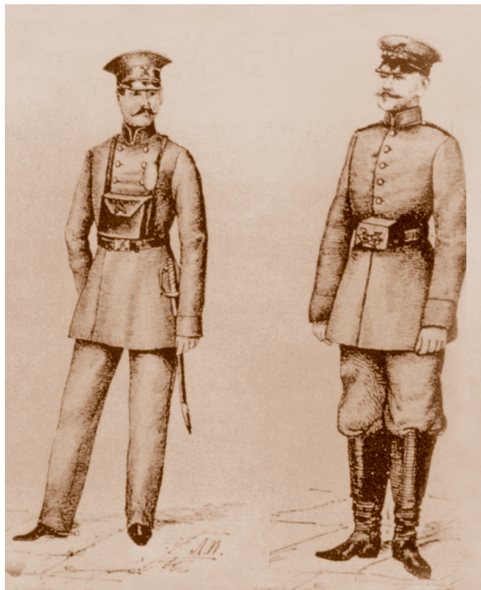
Форма нижних инженерных чинов телеграфного ведомства*