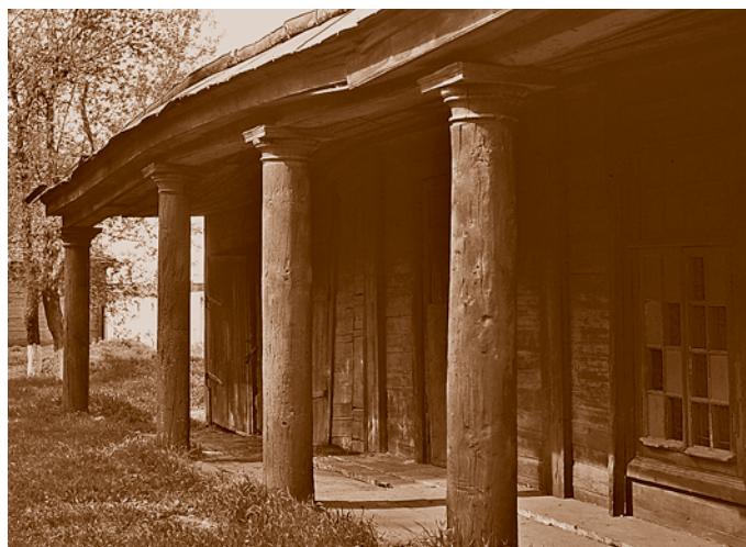
Бывший каретный сарай Омской почтовой станции. Галерея*. 1843. Один из немногих сохранившихся образцов деревянного зодчества начала XIX в. (на территории военного госпиталя, ул. Гусарова, 4)

В 1862 г. из Екатеринбурга до Омска была протянута телеграфная линия , а в 1874 г. в связи с развитием телеграфной сети и созданием телеграфных станций в крупных поселениях Акмолинской области было учреждено