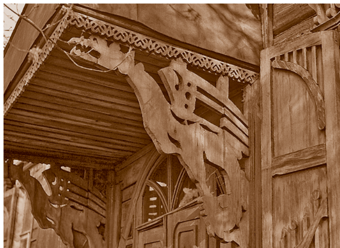
Грифоны – отголоски магической символики древних славян в омской домовой резьбе*. Жилой дом начала XX в. на Кирпичной улице (сейчас – ул. Мичурина, 48)