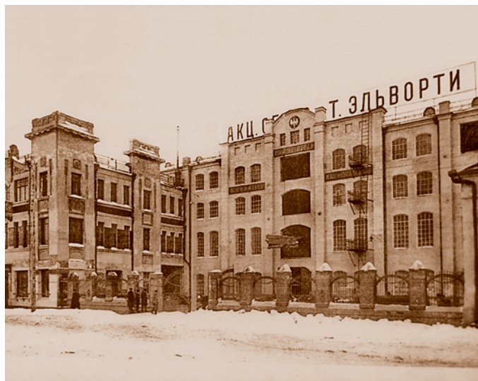
Комплекс зданий акционерного общества сельскохозяйственных машин «Р. и Т. Эльворти». 1914. Масштабная даже по сегодняшним меркам постройка, заставляющая вспомнить европейские средневековые замки. В убранстве фасада использован мотив солнца – намек на архитектуру древних египетских храмов. Сейчас – Омский филиал Внешторгбанка (ул. Тарская, 6)