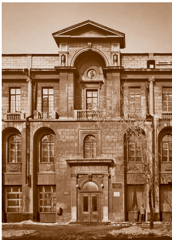
Бывшее здание страхового общества «Саламандра»*. Фрагмент южного фасада. 1914. Сейчас – городская поликлиника № 1

На другой стороне улицы находятся дом товарищества Российско-Американской резиновой мануфактуры «Треугольник», возведенный по проекту Н. Н. Веревкина, и дом товарищества «Тверская мануфактура» том-