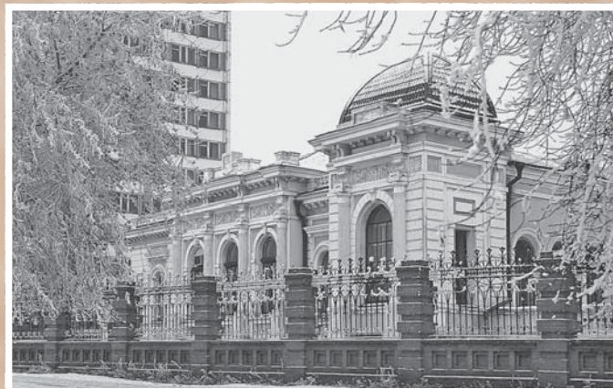
Бывший особняк К. А. Батюшкина на ул. Береговой*. 1902.

Использованы черты классической европейской архитектуры, элементы древнерусского зодчества и стилизованные в восточном духе формы. Строился для Западно-Сибирского отдела Русского географического общества и первого в городе общедоступного музея. Сейчас – Государственный центр народного творчества