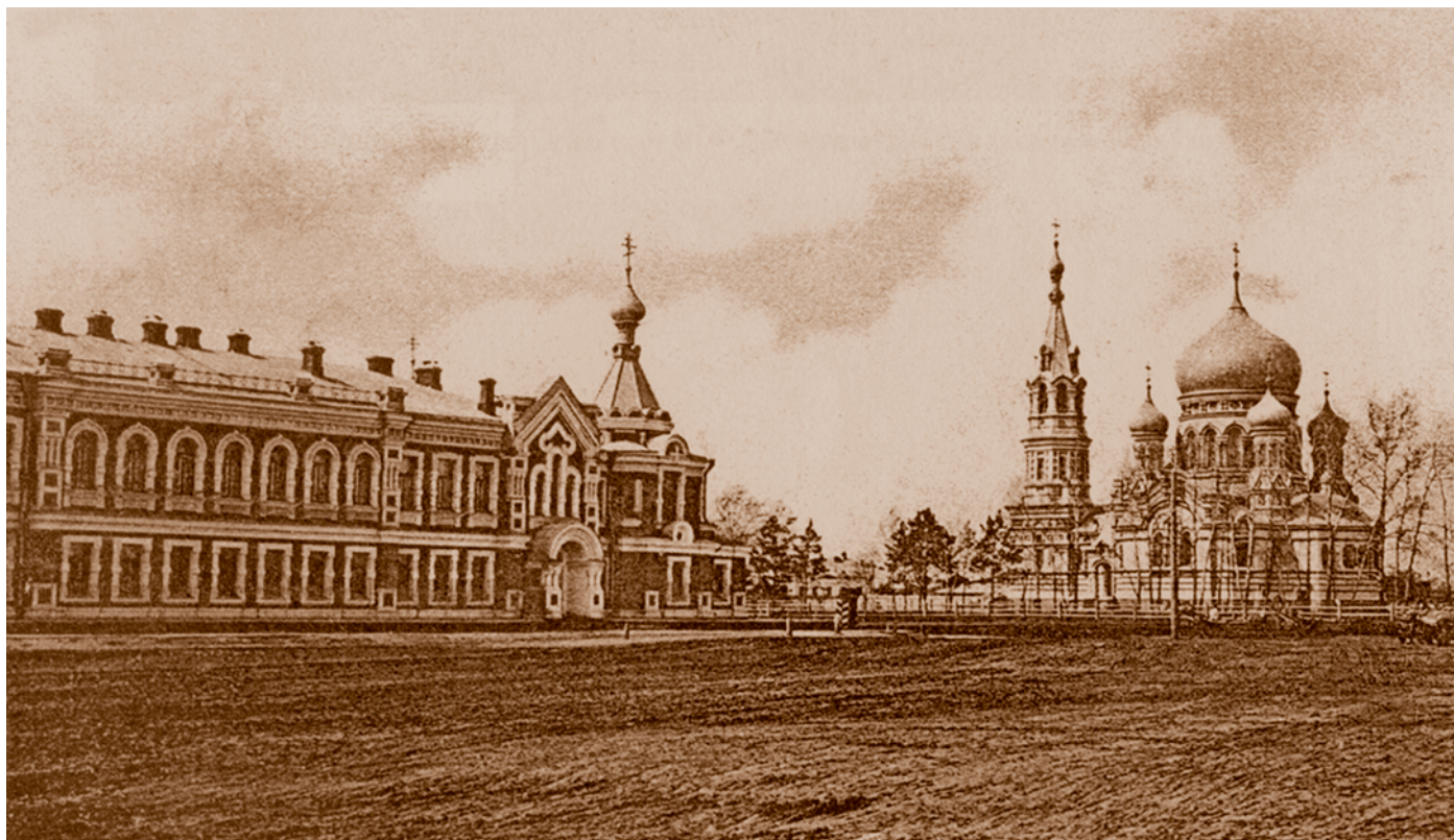
Архиерейский дом с крестовой церковью (1907 г.) и Успенский кафедральный собор (1898 г.). Открытка начала XX в.

Здания неправославных конфессий. Вопрос о строительстве мечети в Омске был поднят еще в начале 1820-х гг.