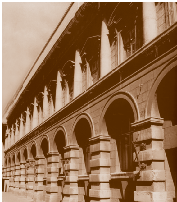
Бывший дом товарищества Российско-Американской мануфактуры «Треугольник» на Гасфортовской улице. 1915.