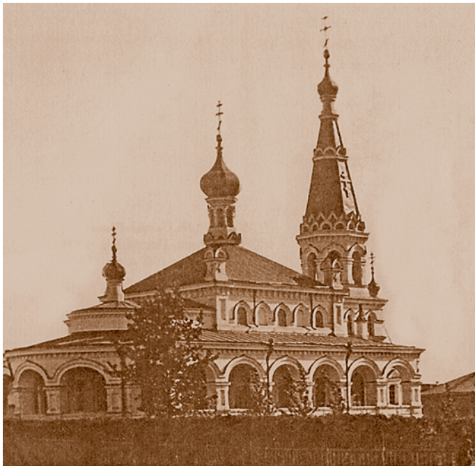
Церковь во имя Святого Михаила Клопского (Галкинская) в Новослободском форштадте. 1902. Из фондов ГУИСА. Снесена в конце 1950-х гг.

устроенного в середине XIX в. на западной окраине города, за Бутырским форштадтом. Об облике храма можно судить по единственной уцелевшей дореволюционной фотографии. Это церковь зального типа с восьмигранным барабаном под низким куполом, с луковичной главкой и изящной шатровой колокольней. Стены прорезаны арочными окнами, прикрыты лопатками и оформленными нишами по краям от южного входа. Каждая грань деревянного барабана имеет килевидное завершение.