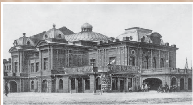
Городской театр на Базарной площади. 1901–1905.

Тип жилого усадебного дома с архитектурными формами, близкими эпохе Ренессанса, и двухъярусным классицистическим крыльцом. В нем размещались резиденция Верховного правителя России А. В. Колчака, Сибирское управление учебными заведениями, детский дом, костно-туберкулезный санаторий, цех картографической фабрики, сейчас здесь городской дом торжественных обрядов (ул. Иртышская набережная, 9)