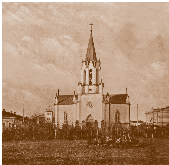
Костел – римско-католическая церковь на углу Новой и Костельной улиц. Открытка 1910-х гг.

Костел был возведен на площади у Никольского казачьего собора между зданиями Общественного собрания и мечети. В интерьере были прекрасный иконостас работы ссыльных поляков и орган. В 1889 г. прихожане-католики обратились с прошением построить колокольню в честь ознаменования «чудесного спасения драгоценной жизни Их Императорских Величеств и Августейшего Семейства от опасности, угрожавшей при крушении императорского поезда 17 октября минувшего года на Харьковско-Азовской железной дороге». Вскоре появилась небольшая колокольня, выполненная в стилистическом единстве с костелом – проемы в форме стрельчатых арок, башенки и другие элементы декора. С западной стороны был построен придел для ризницы с архивом.