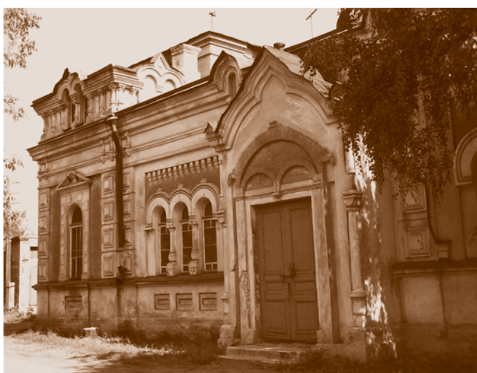
Церковь во имя иконы Божьей Матери «Всех скорбящих Радости» на территории военного госпиталя в Бутырском форштадте. 1906 (сейчас – ул. Гусарова, 4, кор. 3). Из книги Н. И. Лебедевой «Храмы и молитвенные дома Омского Прииртышья» (Омск, 2003)

У моста через Омь в 1907 г. возвели часовню во имя Серафима Саровского Чудотворца и Святителя Алексия, посвятив ее рождению наследника-цесаревича Алексея,