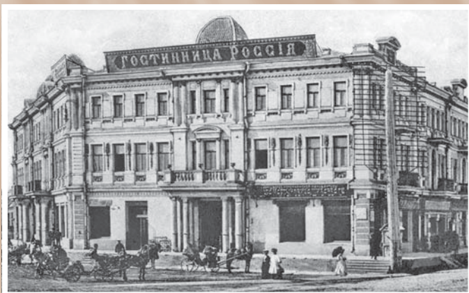
Здание на пересечении Чернавинского (Любинского) проспекта и Санниковского переулка. 1905–1906.

В 1898 г. построена нагорная часть с характерными для эпохи эклектики барочными и классицистическими деталями фасада, позже – протяженное крыло под горой. В начале 1900-х гг. пристроили швейные мастерские. В советское время – филиал универмага «Центральный», сейчас – торгово-офисное здание (ул. Ленина, 5)