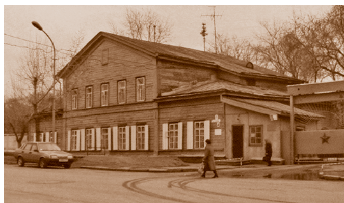
Здание военного госпиталя на Скорбященской улице в Бутырском форштадте (сейчас – ул. Гусарова, 4).

В 1833–1836 гг. в стиле безордерного классицизма было построено двухэтажное каменное здание Дома присутственных мест (на углу современных улиц Красный Путь и Интернациональная). Вскоре в нем разместили Главное управление Западной Сибири. Здание «находится вне крепости и весьма замечательно по стилю, обширности, эффектному виду. Тут сверх Главного управления помещаются: Областное правление Сибирских киргизов (так в XIX в. называли казахов. – Ред. ) и казначейство», –