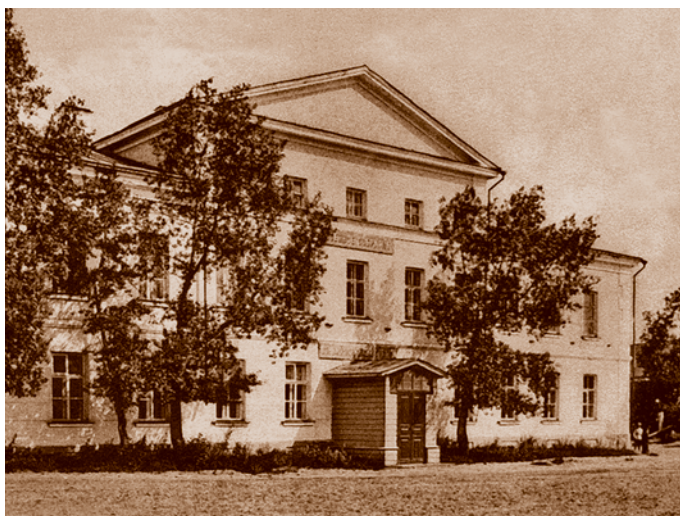
Здание Военного собрания. Открытка начала XX в. Сейчас – гарнизонный дом офицеров (ул. Партизанская, 12). Памятник градостроительства и архитектуры федерального значения

К 1860 г. в городе значительно выросло число жилых домов – до 2 102 (только 31 каменный). Деревянное зодчество не отставало от общего направления русской архитектуры второй половины XIX в., когда сменяли друг друга или вместе уживались формы различных стилей прошлых эпох. Этим и объясняется такое разнообразие декоративного убранства фасадов омских деревянных домов. Можно отметить как характерный образ русской стилизации оформление парадного входа жилого дома в Казачьей слободе по ул. Почтовой, 45 (Казачья слобода – условно названная территория исторического центра Омска, ограниченная улицами Лермонтова, Валиханова, Маршала Жукова и Куйбышева. Проектным институтом «Омскгражданпроект» был разработан план регенерации Казачьей слободы. Облик жилых домов представляет богатство архитектурной пластики фасадов и отражает стилистическое разнообразие русской архитектуры этого времени).