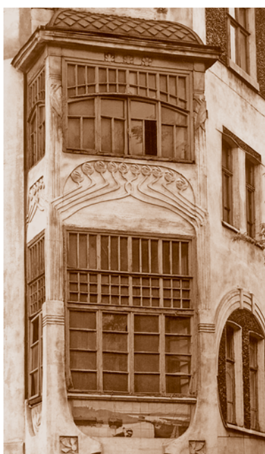
Фрагмент (окно) доходного дома А. В. Печокаса на углу улиц Тобольской и Надеждинской*. Начало 1910-х гг. Сейчас общежитие № 2 аграрного колледжа (ул. Орджоникидзе, 14)

Композиция фасада здания кинотеатра подчинена его внутренней планировке, которая довольно своеобразна. Это одно из первых в Омске доходных зданий, предназначенных для общественных зрелищ. Здесь все подчинено удобству зрителей. Интерьер насыщен лепным декором, сочная пластика которого выполнена в стиле модерна. Маскароны (скульптурная деталь в виде маски. – Ред. ) в виде лица юной девушки с распущенными волосами, украшенными цветами, вызывают ассоциации с творчеством прерафаэлитов, сюжетом из «Гамлета» У. Шекспира