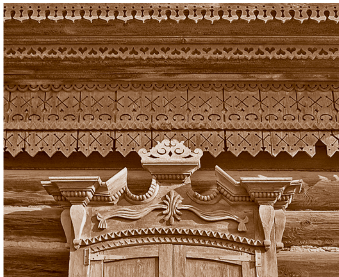
Символика древних славян на резном «свисающем» фризе жилого дома по Тобольской улице*. Вторая половина XIX в. (сейчас – ул. Орджоникидзе, 89)