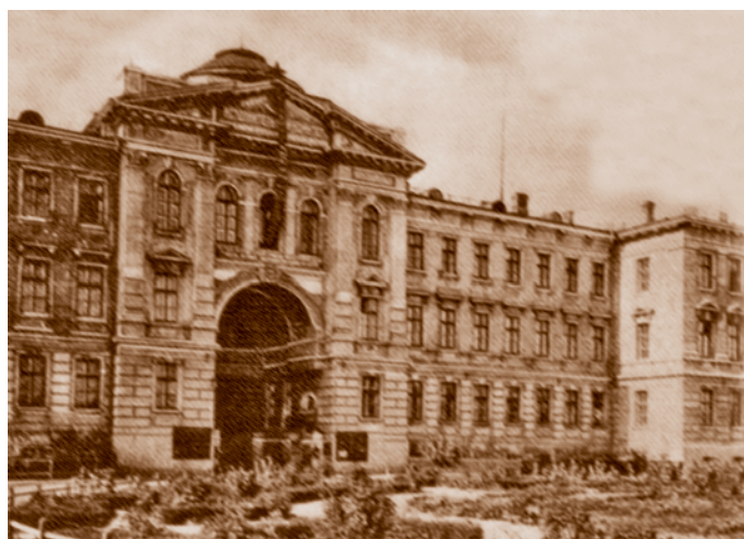
Дом судебных установлений на Соборной площади. 1914–1916 (сейчас – Законодательное собрание Омской области, ул. Красный Путь, 1).

Место для Дома судебных установлений отвели на бывшей эспланаде против кафедрального собора. Величественное здание, соответствующее своей идеологической сути, строилось по проекту академика архитектуры, преподавателя института гражданских инженеров, петербургского зодчего В. А. Пруссакова с 1914-го по 1916 г. (в строительстве здания принимали участие иностранные военнопленные, чей труд широко использовался в Омске в 1915–1918 гг. – Ред. ). Мощный компактный объем здания с внутренним двором был отодвинут в глубину участка. Близкий к квадрату, замкнутый прямоугольник корпусов окружает парадный двор, в который вел гигантский