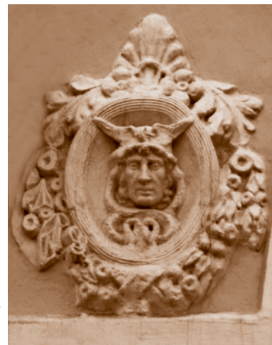
Маскарон в крылатом шлеме покровителя торговли бога Меркурия на фасаде Омского областного музея изобразительных искусств им. М. А. Врубеля – бывшего торгового корпуса на Базарной площади (ул. Ленина, 23)*

Сложная и выразительная архитектура Дома контор (1917 г.), в котором размещались Русско-Азиатский банк