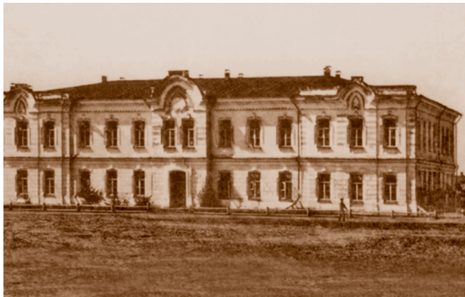
Пансион 1-й женской гимназии. 1883. Открытка начала XX в. Сейчас – торгово-офисное здание (ул. Ленина, 10)

и при этом – с соблюдением чувства меры» (Из XVIII века – в век XXI: история Омска / Н. И. Миненко, В. Г. Рыженко. СПб., 2008. С. 143–144).