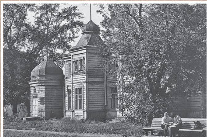
Дом по ул. Музейной, 3*. 1895–1900.

Использованы черты классической европейской архитектуры, элементы древнерусского зодчества и стилизованные в восточном духе формы. Строился для Западно-Сибирского отдела Русского географического общества и первого в городе общедоступного музея. Сейчас – Государственный центр народного творчества