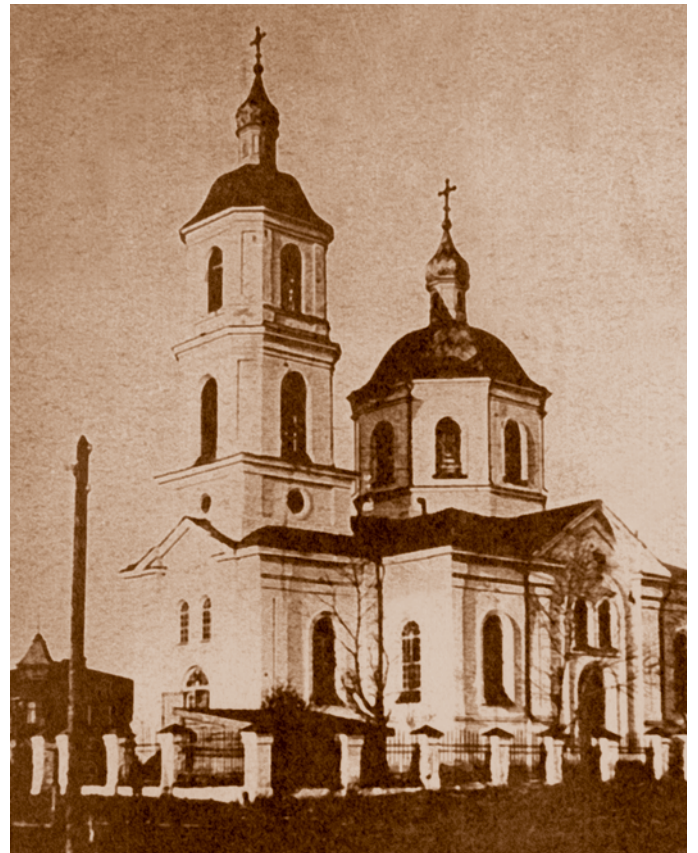
Крестовоздвиженский собор (церковь во имя Воздвижения Животворящего Креста Господня в Бутырском форштадте). 1870. Фотография начала XX в. Закрыт в 1936 г. В 1943 г. возвращен общине верующих

В проекте был использован тип двухчастного храма, состоявшего из помещения самой церкви с полукруглой апсидой и притвора с ярусной колокольней, расположенных на одной оси. Основной объем имел в плане форму квадрата и конструктивно решался по традиционному принципу четырехстолпного сооружения с несущими наружными стенами. Купол перекрывался восьмилотковым сомкнутым сводом, а снаружи очертанием кровли напоминал изогнутые крыши сооружений позднего немецкого Возрождения. В духе Ренессанса по всему периметру здания во втором ярусе колокольни и на барабане купола располагались одиночные и спаренные дорические пилястры – плоские вертикальные выступы на поверхности стены. Оконные и дверные проемы проектировались арочными. Во внутреннем поле фронтонов – тимпанах применены люкарны (небольшие слуховые окна). Конкретно-образное стилевое звучание должны были усиливать высокие порталы с многоступенчатыми лестницами, организованными с трех сторон здания. Арка портала объединяла входную дверь и выше расположенные двоянные окна, оформление которых и медальон между ними были заимствованы из архитектуры раннего Ренессанса. Символическое значение трехкратного ритмического