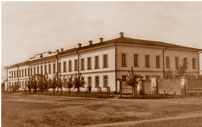
Здание Главного управления Западной Сибири на углу улиц Капцевича (Капцевичевой) и Александровской. В 1918–1919 гг. было занято министерствами Временного Сибирского правительства, затем Министерством внутренних дел Российского правительства, сейчас административное здание (ул. Красный Путь, 7а)

отмечал И. Завалишин. Протяженное двухэтажное классицистическое здание присутственных мест в северной части Омска символизировало собой чиновничий город.