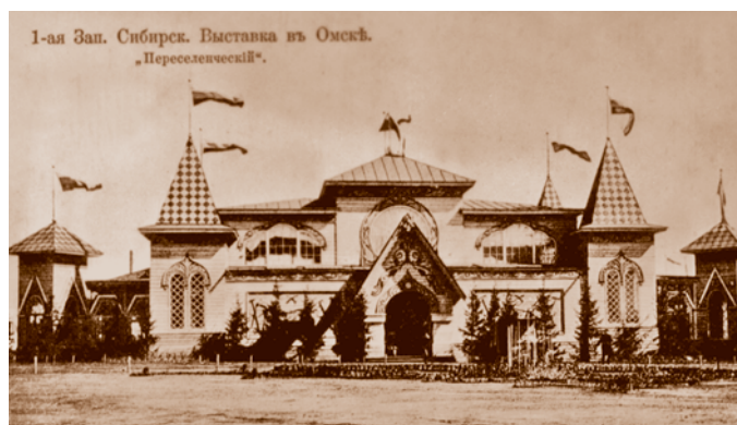
Первая Западно-Сибирская сельскохозяйственная, лесная и торгово-промышленная выставка. Переселенческий павильон. Открытка 1911 г.

Стилевое оформление зданий было различным. Главные ворота напоминали своими башнями Спасские ворота Московского Кремля. Кустарный и переселенческий павильоны были выполнены в традициях русского стиля с использованием дерева – основного материала древнерусской архитектуры. На стенах переселенческого павильона по обе стороны от главного входа размещались два живописных панно П. Д. Шмарова – аллегория переселения в прошлом и настоящем. Научный павильон был выполнен в древнеегипетском стиле: трапециевидные пилоны (столбы), стилизованные орнаменты и рельефы, обелиски, дорожка сфинксов. Крыша павильона была построена из стеклянных рам для лучшего освещения. Павильон открывала