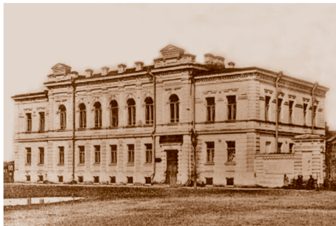
Здание Омского отделения Государственного банка (с 1997 г. здесь находится Головной расчетно-кассовый центр Главного управления Центрального банка РФ по Омской области).