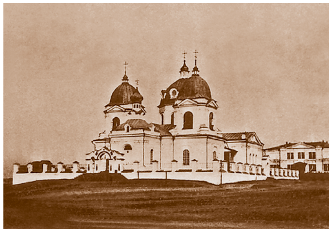
Ильинская церковь. 1778–1789. Открытка 1911 г. Снесена в середине 1930-х гг.

Оригинальность замысла указывает на авторство выдающегося зодчего. Вероятно, проект был заказан столичному мастеру. Омский храм можно отнести к немногочисленному кругу раннеклассицистических двухколоколенных храмов России. Возможно, строителями Ильинской церкви были представители семьи Черепановых, которых приглашали для строительства церквей и письма иконостасов в Петропавловск, Ямыш, Бийск. Например, в 1788 г. Иван Черепанов именно из Омска отправился в Бийск для строительства там собора. Значит, он мог быть строителем