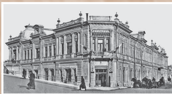
Здание торгового дома М. А. Шаниной на пересечении Чернавинского (Любинского) проспекта и Гасфортовской улицы.

Пример эклектичной пластики с преобладанием мотивов барокко и классицизма (ул. Ленина, 8а)