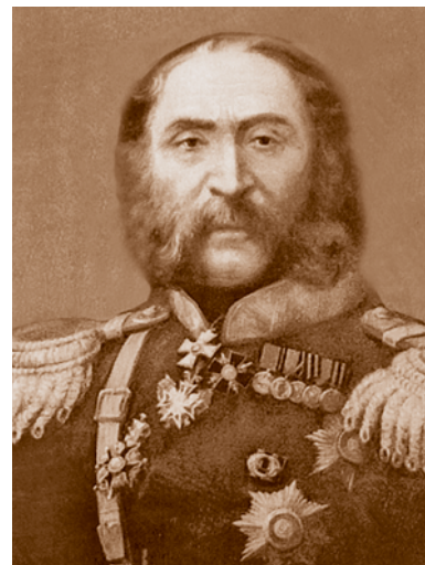
Г. Х. Гасфорт – генерал-губернатор Западной Сибири, командующий отдельным Сибирским корпусом

Сибирские чиновники имели особые привилегии, которые в основном заключались в следующем: всем классным чиновникам при определении на службу в Сибирь выдавались денежные пособия в размере годового оклада жалованья; двойные прогоны до места назначения; прибавочные оклады за каждые пять лет службы в Сибири (по 25 % оклада, пока сумма прибавки не сравняется с суммой штатного оклада жалованья); сокращение срока выслуги ордена Святого Владимира четвертой степени; три года сибирской службы считались за четыре при выслуге пенсии; устанавливался большой размер самой пенсии; увеличивались сроки оплачиваемых и неоплачиваемых отпусков; предоставлялись казенные пособия для обучения детей;