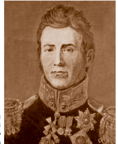
П. М. Капцевич – первый генерал-губернатор Западной Сибири, командир отдельного Сибирского корпуса

С годами пребывание Главного управления края в Тобольске приобретало все больше противников, особенно среди тех лиц, которые были непосредственно знакомы с Сибирью, а не смотрели на нее из далекого Петербурга.