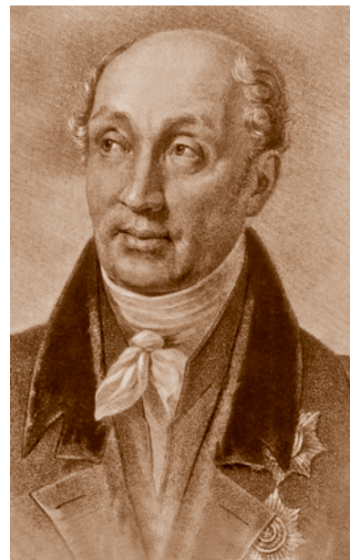
М. М. Сперанский – российский государственный деятель. Дважды – в 1819 и 1820 гг. посещал Омск

Инициатива создания на территории юга Западной Сибири и Киргизской степи (сейчас – Северный Казахстан) области с центром в Омске принадлежит велико-