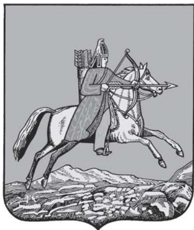
Герб Омской области

полковницы Безносиковой (двухэтажное деревянное здание на каменном фундаменте с флигелем в Новоильинском форштадте, позднее выкупленное в казну).