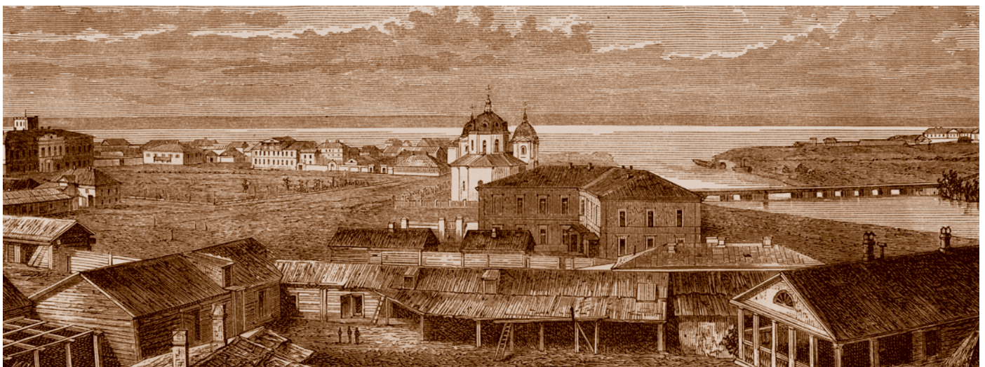
Омск в конце XIX в.: Ильинская церковь, перед ней приют «Надежда», жилые дома... Рисунок из книги «Живописная Россия» (СПб., 1886. Т. 11)

имущества, «присвоенные другим состояниям империи, инородцы приобретают на основании общих законов». Согласно статьям 119 и 120, земли, занимаемые кочевниками, как и по «Временному положению» 1868 г., считались государственной собственностью, но оставались у них в бессрочном общественном пользовании. Однако в примечаниях к статье 120 «Степного положения» содержалось указание, что излишние для кочевого населения земли поступают в ведение Министерства государственных имуществ. В результате, в связи с тем что решение вопроса о наличии или отсутствии излишков земли было предоставлено царской администрации, создавались широкие возможности для отчуждения земель у коренного населения в пользу русских переселенцев. Коренное население казахской степи было обложено также высокой «кибиточной» податью – 4 руб. с кибитки, т. е. с каждой семьи кочевников. Не являясь связанной с размером земельной площади, «кибиточная» подать была своеобразной феодальной рентой за право проживания на «казенной» земле.