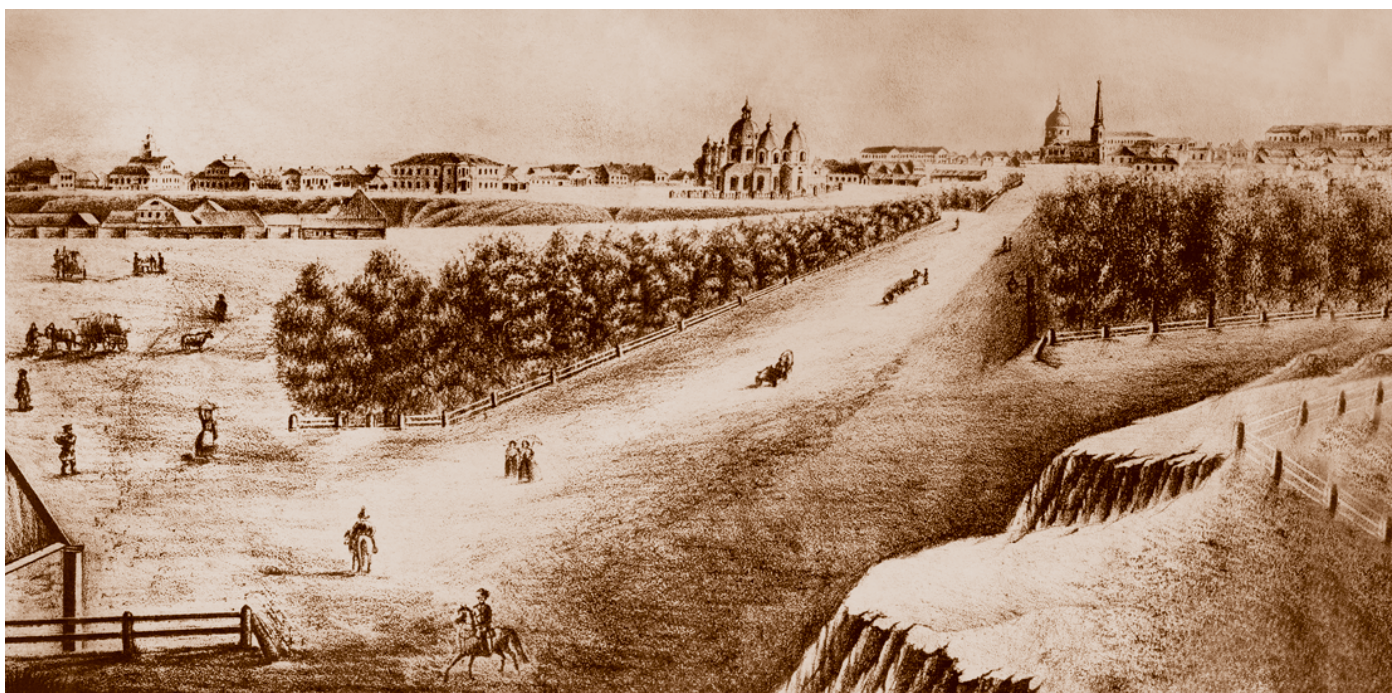
Вид Омска. С рисунка А. Померанцева. 1854. Из книги «Старый Омск: иллюстрированная хроника событий» (Омск, 2000)

Административное значение Омска подчеркивали не только специфичный социальный состав его населения, особенности городского хозяйства и культурного развития, но и архитектурный облик города. В отличие от торгово-промышленных Тюмени и Томска, наиболее