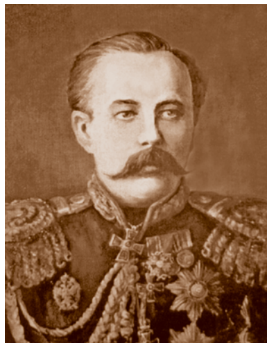
Н. Г. Казнаков – генерал-губернатор Западной Сибири, командующий войсками Западно-Сибирского округа, наказной атаман Сибирского казачьего войска

к поступлению в Сибирскую военную гимназию был учрежден подготовительный пансионат. Принимались меры по улучшению материального положения сельских учителей, увеличению пособия станичным обществам на создание школ. Умножилось число городских и сельских приходских училищ, открывались интернаты для казахских детей, фельдшерские школы. С самого приезда в Омск Казнаков вплотную занялся вопросом упорядочения и ограничения уголовной ссылки – этой давней язвы Сибири, терзавшей ее «нравственное здоровье». При Н. Г. Казнакове в городе началось улучшение демографической ситуации.