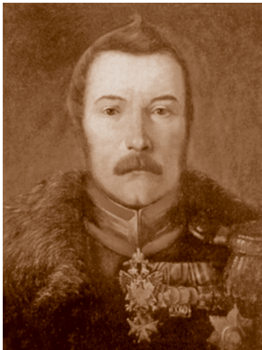
П. Д. Горчаков – генерал-губернатор Западной Сибири, командир отдельного Сибирского корпуса. Реализовал идею о переводе управления Западной Сибирью из Тобольска в Омск