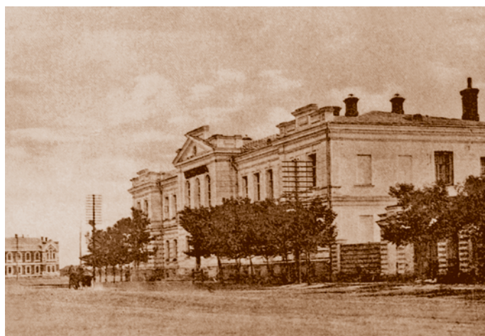
Губернское казначейство и Казенная палата. Из фондов МИСО. Сейчас – административно-офисное здание (ул. Красный Путь, 3)

Последний генерал-губернатор Западной Сибири – Г. В. Мещеринов, бывший личный адъютант императора Александра II, единственный из омских генерал-губернаторов кавалер ордена Андрея Первозванного. Он прибыл в Омск в 1881 г. В столице в это время уже обсуждались планы нового административного переустройства края. Западно-Сибирское генерал-губернаторство предполагалось упразднить, включив Омск и Акмолинскую область