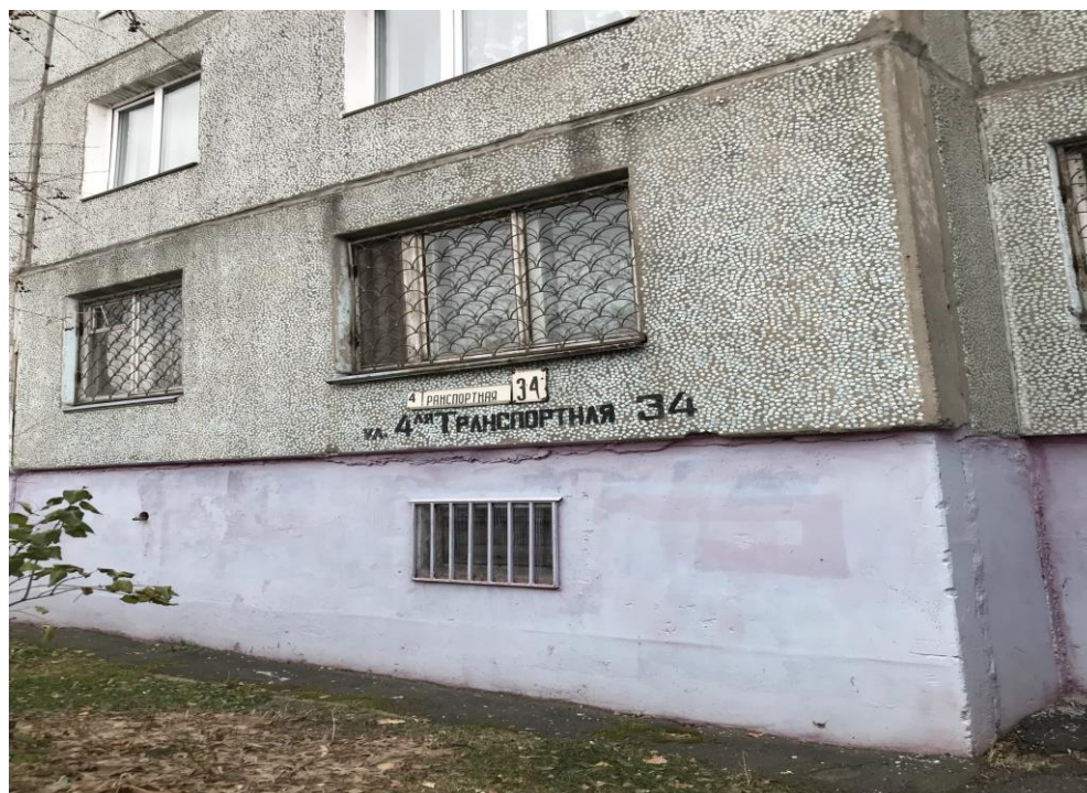
Фото 1. Объект недвижимости. Дата и время съемки: 31.10.2022, 09:37.