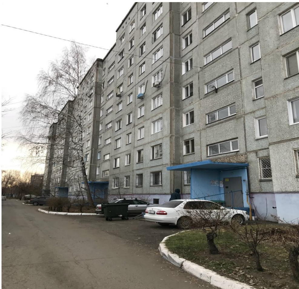
Фото 5. Объект недвижимости. Дата и время съемки: 31.10.2022, 09:37.