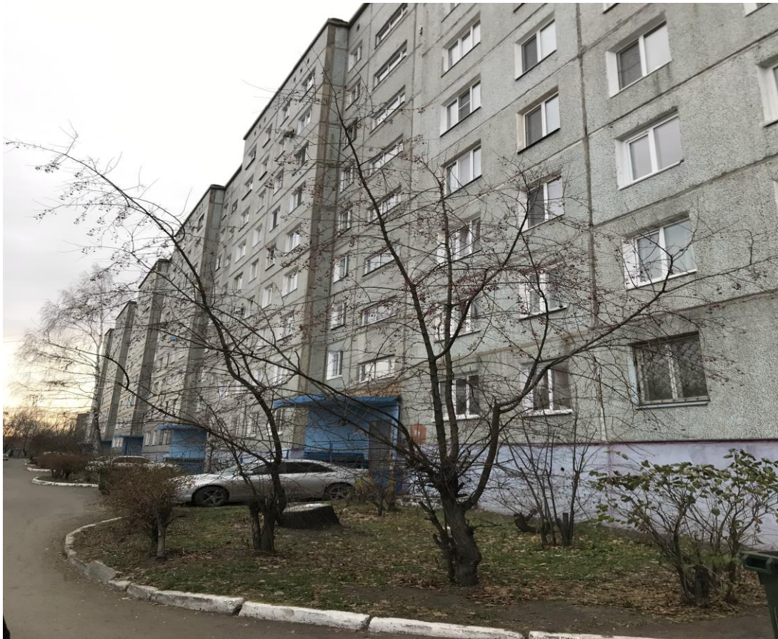
Фото 2. Объект недвижимости. Дата и время съемки: 31.10.2022, 09:37.