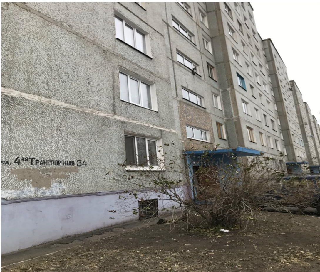
Фото 3. Объект недвижимости. Дата и время съемки: 31.10.2022, 09:37.