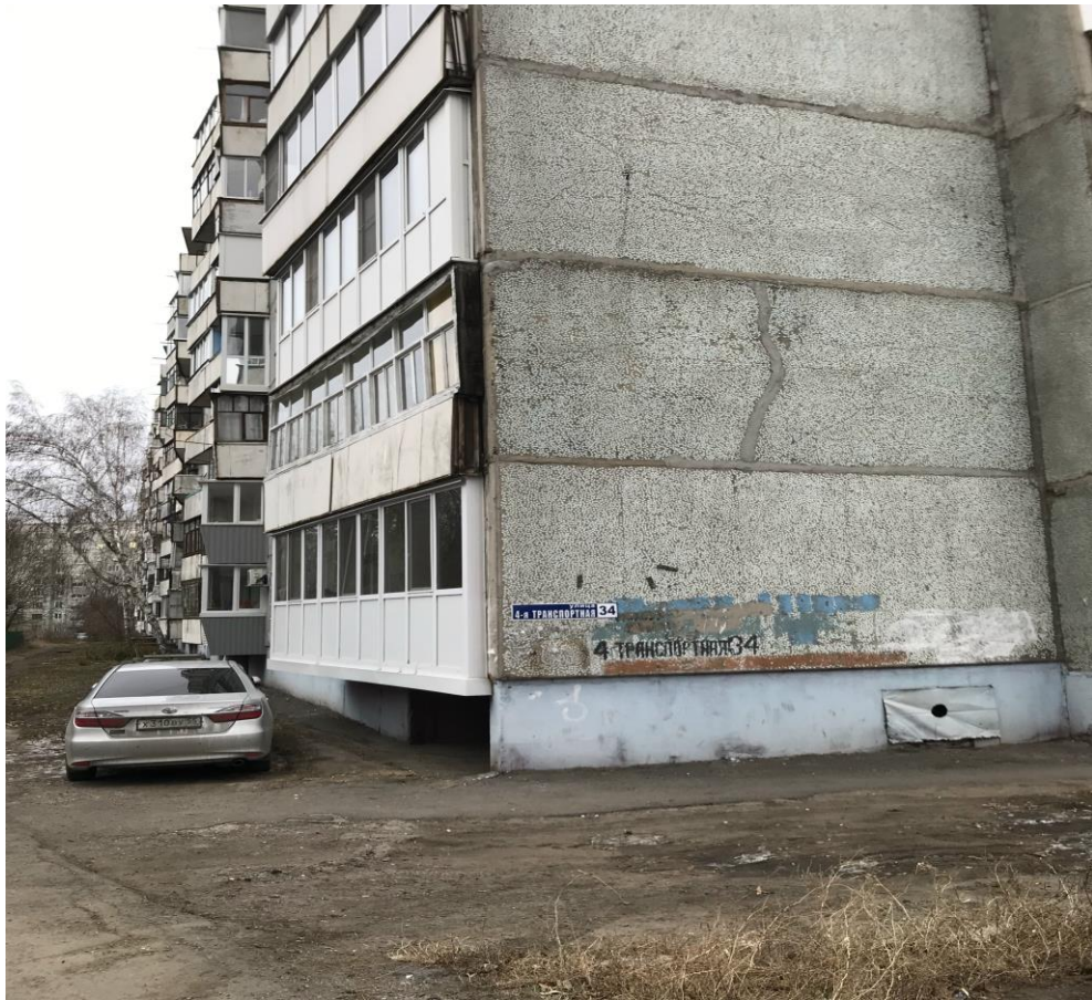
Фото 4. Объект недвижимости. Дата и время съемки: 31.10.2022, 09:37.