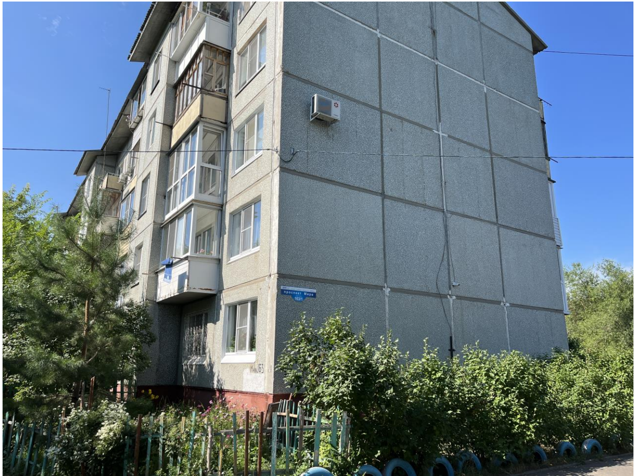
Фото 2. Объект недвижимости. Дата и время съемки: 10.08.2023, 10:25.