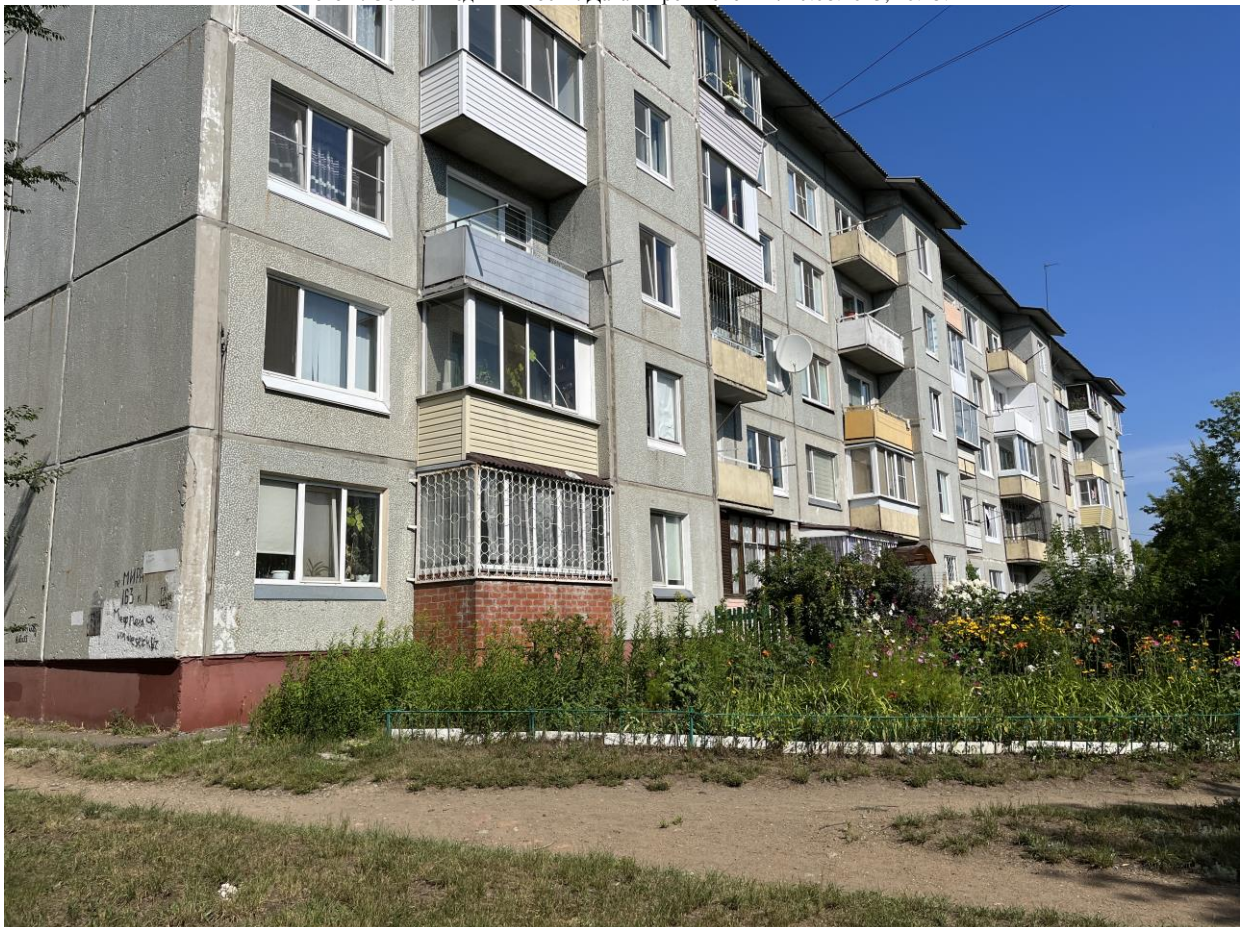
Фото 3. Объект недвижимости. Дата и время съемки: 10.08.2023, 10:25.