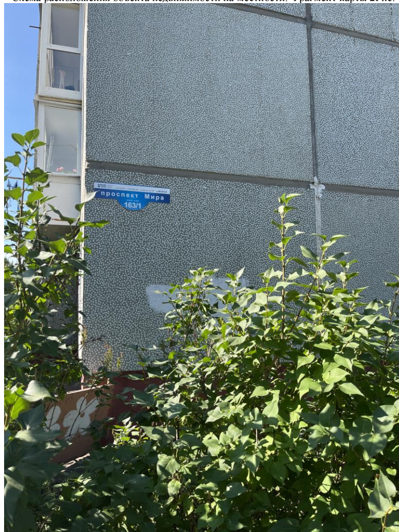
Фото 1. Объект недвижимости. Дата и время съемки: 10.08.2023, 10:25.