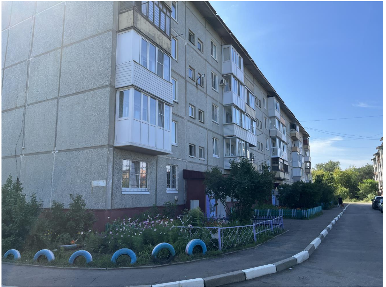
Фото 4. Объект недвижимости. Дата и время съемки: 10.08.2023, 10:25.