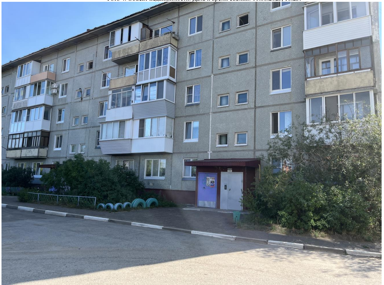
Фото 5. Объект недвижимости. Дата и время съемки: 10.08.2023, 10:25.