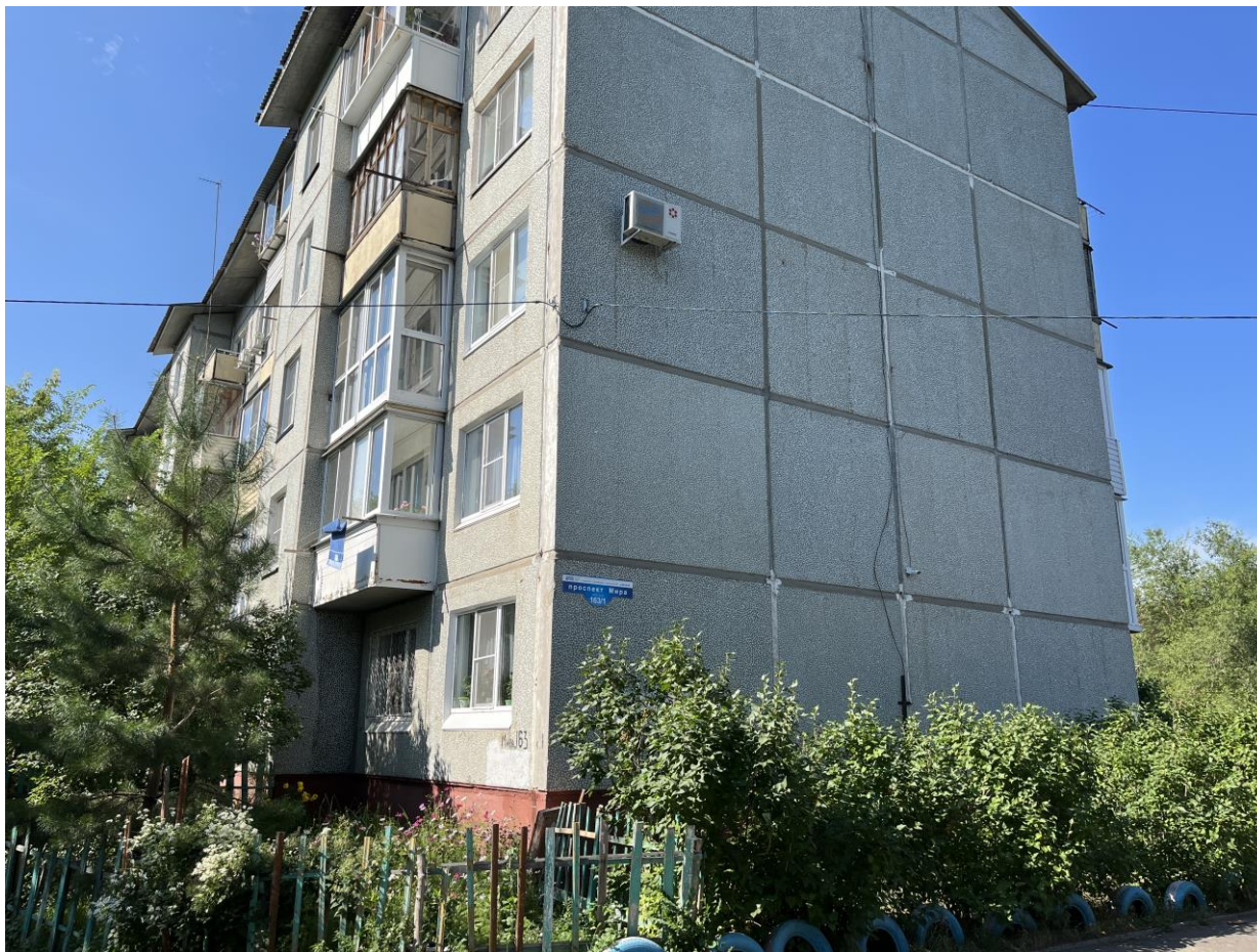
Фото 2. Объект недвижимости. Дата и время съемки: 10.08.2023, 10:25.