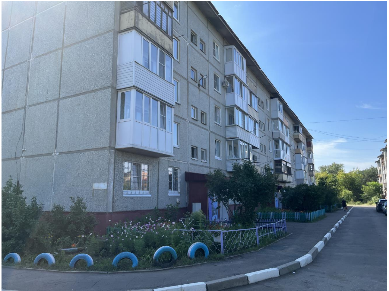
Фото 4. Объект недвижимости. Дата и время съемки: 10.08.2023, 10:25.