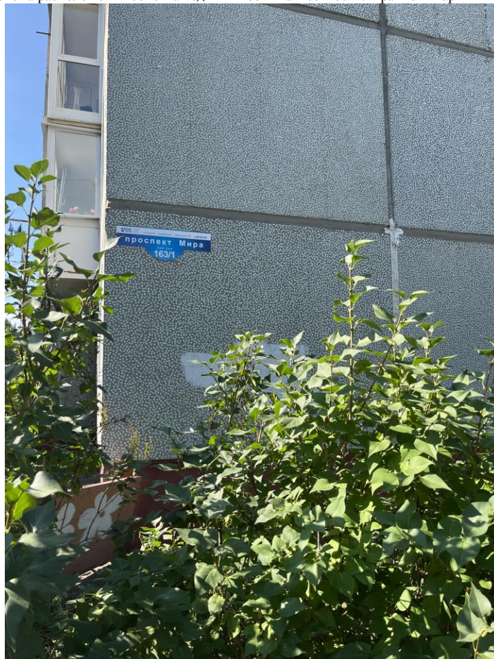
Фото 1. Объект недвижимости. Дата и время съемки: 10.08.2023, 10:25.